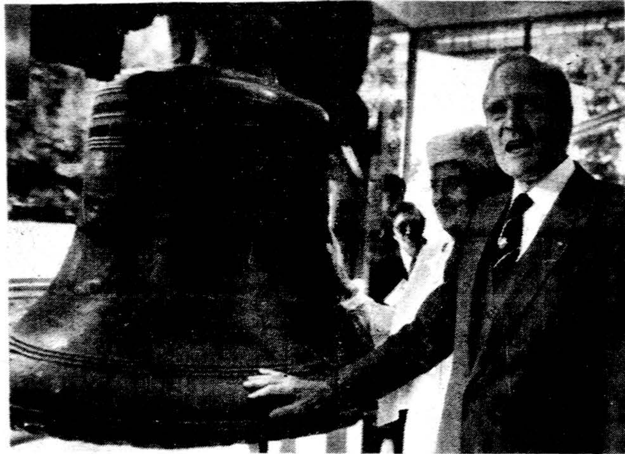
Vakarų Vokietijos prezidentas Karl Carstens Philadelphiaje prie Laisvės Varpo. Prezidentas vizituoja Amerikos vokiečių kolonijas, kurios