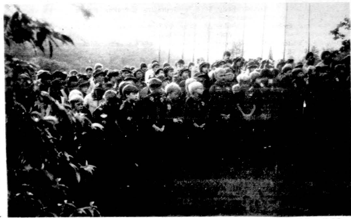
Skautiškos gretos Jubiliejinėje stovykloje.