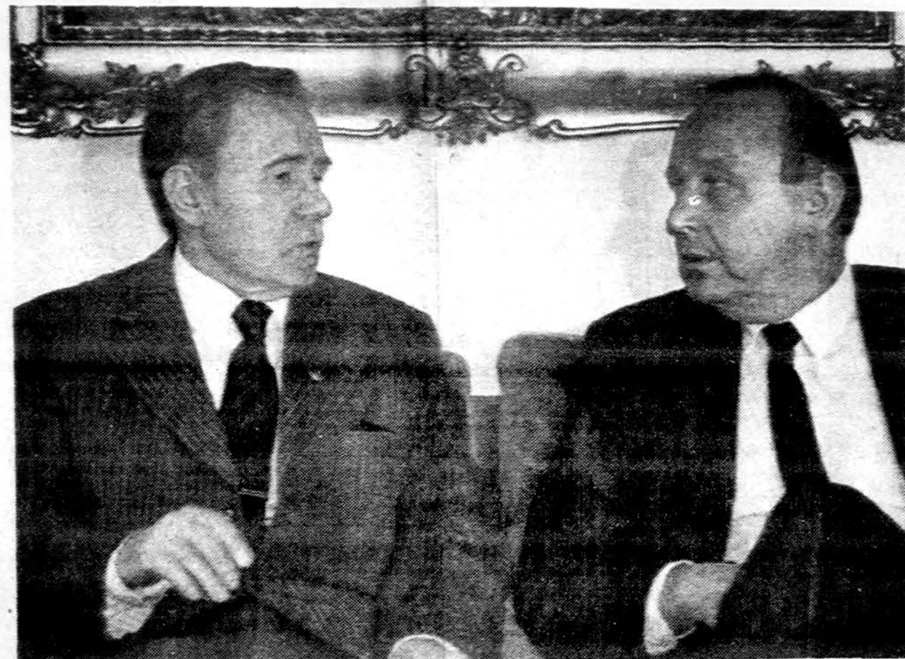
Sovietų Sąjungos ir Vakarų Vokietijos užsienio reikalų ministrai dvi dienas tarėsi Venoje dėl Europoje kilusios padėties. Santykiai įsitempė, kai NATO valstybės nutarė įsigyti naujų

— Izraelio premjeras pakvietė naują finansų ministrį, tos pačios Heruto partijos narį Yigal Cohen-Orgad. Jis ešą partijos „vanagas“, naujų sodybių arabų žemėse steigimo šalininkas, geras gynybos ministerio Arenso draugas. — Buves japonų premjeras Tanaka, nuteistas už kyšų iš Amerikos lėktuvų bendrovės ėmimą, pasakė, kad jis teismo sprendimą apeliuos ir nepasitvarkys iš Japonijos parlamento, kurio narys jis — jau 36 metai.