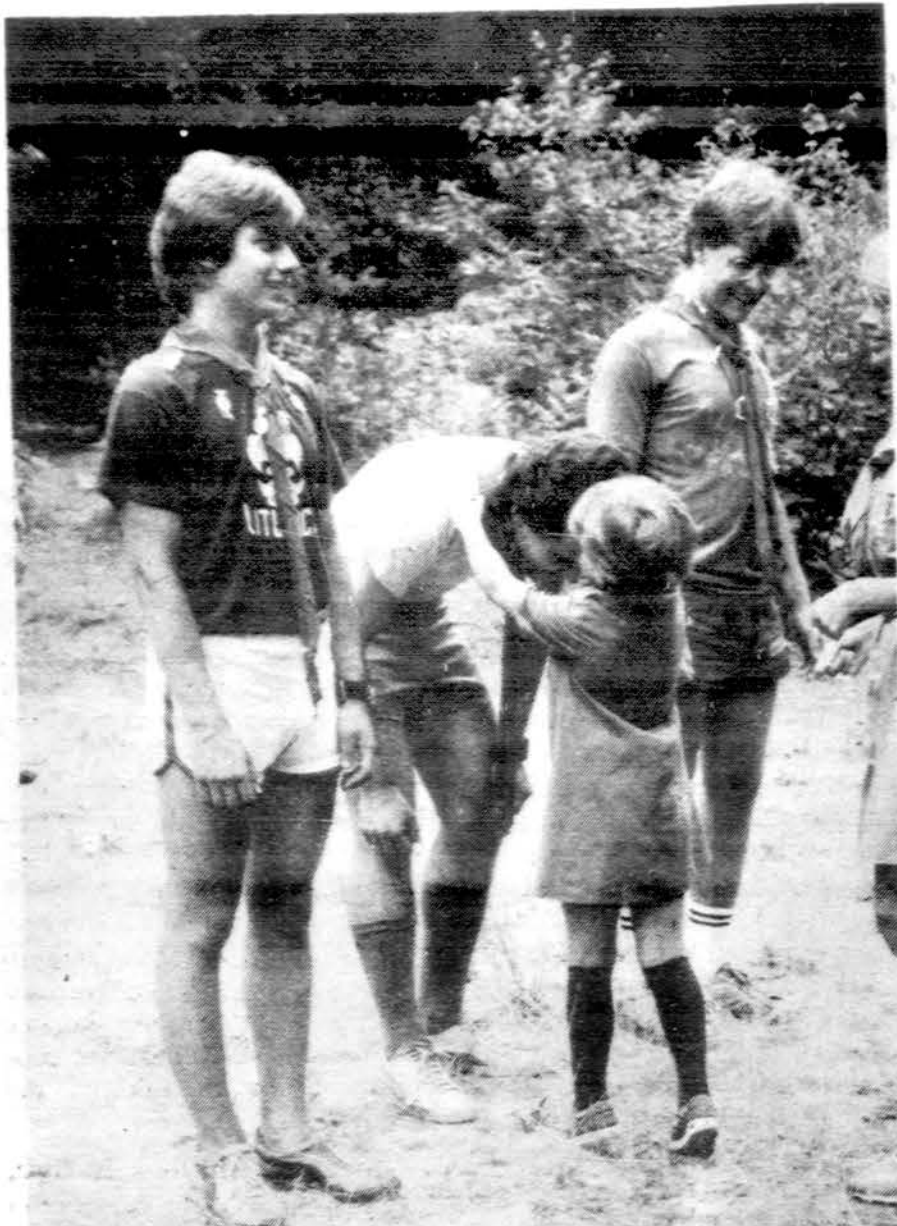
Paukštytė saldinių karoliais papuošia brolii skautų vyti.

V. s. fil. Petras Molis informuoja, kad europiečiai skautai vadovai mums buvo