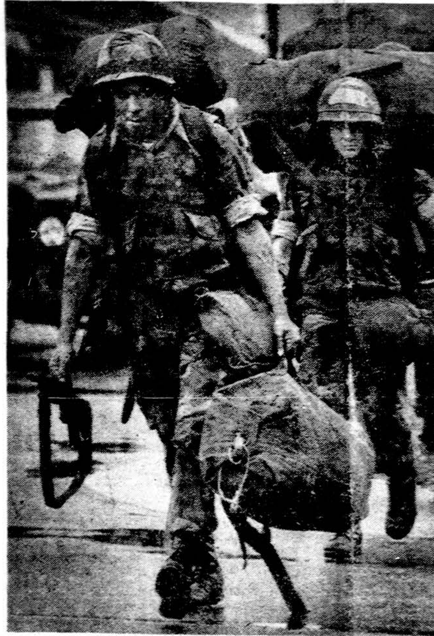
JAV jūrų laivyno pestininkai iš Camp Lejeune bazės Šiaurinėje Karolinoje turėjo vykti į Libaną, tačiau karo laivai pasuko į Karibų jūrą, kur Grenadoje įvyko karinis perversmas. Nuosaikus komunistas premjeras Bishop buvo sušaudytas. Valdžią paėmė radikalesnių „marksistų“ grupė. Vakar saloje išsikėlė 1,500 marinių.

kurios išlaiko gyvas savo krašto vertybes Naujajame pasaulyje. Priminęs Lietuvos kančias, prezidentas užtikrina, kad jo vyriausybė susirūpinusi nuolatiniu žmogaus teisių ir tautos suverenumo pažeidimu Lietuvoje. Prezidentas užtikrina, kad JAV vyriausybė laikysis inkorporacijos nepripažinimo politikos, stipriai jausdama viltis, kad ateitis atneš laisvę lietuviai tautai.