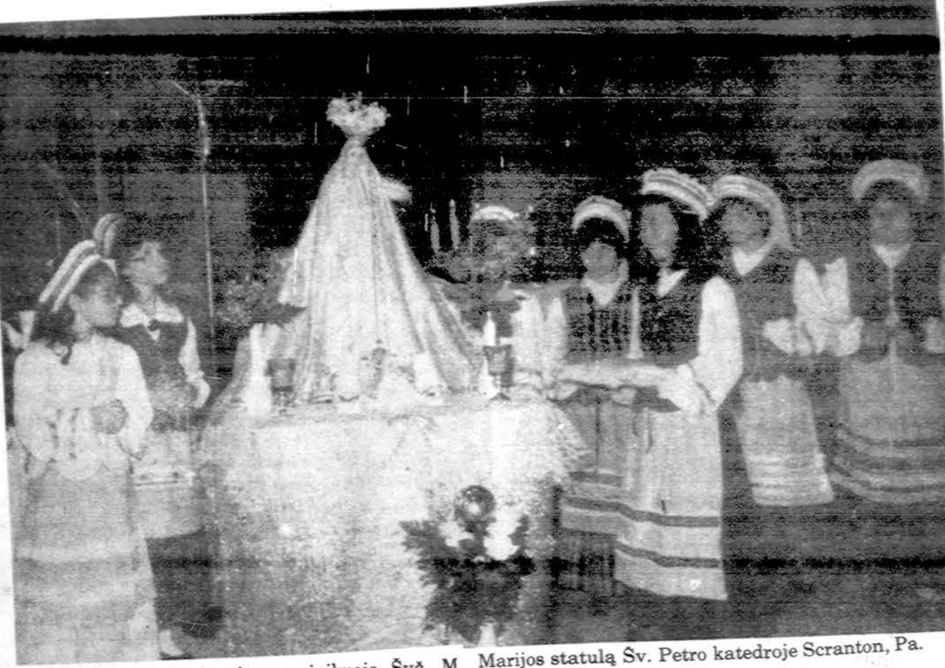
Lietuvos Vyčių jaunimas vainikuoja Švč. M. Marijos statulą Šv. Petro katedroje Scrantone, Pa.

Be JBANC veiklos, teko dirbti ir kitose aukščiau minė-tose organizacijose. National Confederation of American Ethnic Groups turėjo savo kongresą. Ten reprezentavau tarybą ir inėšiau specialią skiltį į rezoliuciją, kur Ameri-kos valdžia yra prašoma dau-giau rūpintis Lietuvos, Latvi-jos ir Estijos valstybių išlaisvinimu. Šioje visos Ame-rikos etninių grupių federaci-