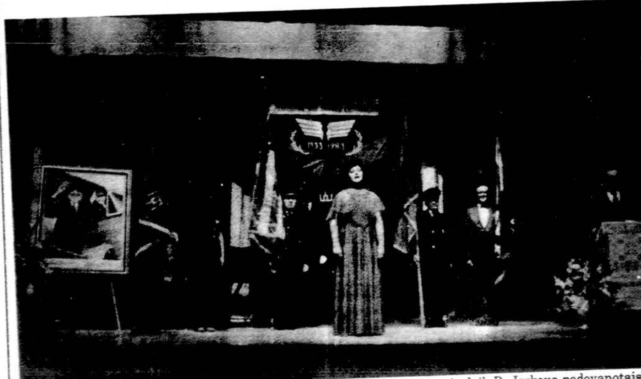
Dariaus ir Girėno tragiško žuvimo 50 metų sukakčiai paminėti rugsėjo 11 d. Kultūros Židinys, Brooklyne, Šalių kuopa surengė šventę. Matomas bendras baizdas scenoje, papuoštoje

Kas duoda gerą patarimą — stato viena ranka. Kas duoda gerą patarimą ir gerą pavyzdį — stato abiem rankom; bet kas duoda gerus pamokymus, o savo gyvenimu — blogą pavyzdį, tas viena ranka stato, o antra griaua. Fr. Bacon