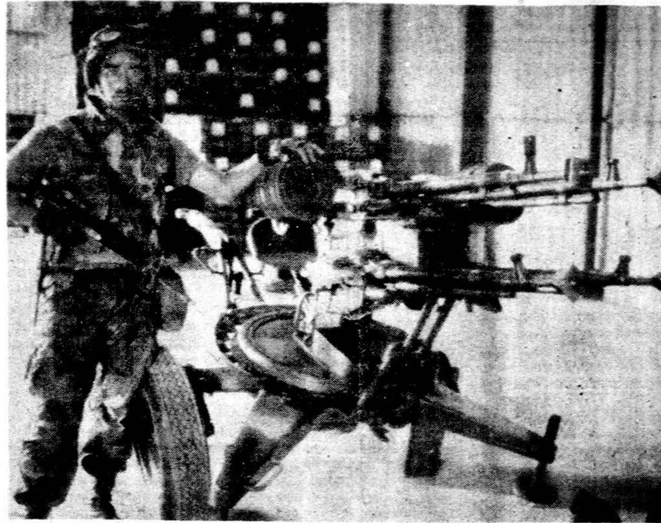
Amerikietis kareivis Grenados saloje saugo sovietų gamybos ginklų sandėli. Priekyje — lengvas priešlėktuvinis pabūklas, kuriuo kubiečiai apšaudė pirmuosius JAV helikopterus, atsikridusius užimti salos aerodroma.

Generolas Austin paskelbė, kad valdžioje jau istisi metai buvęs skilimas, tačiau apie jį „masėms“ nebuvo skelbta, norint išlaikyti vienybę