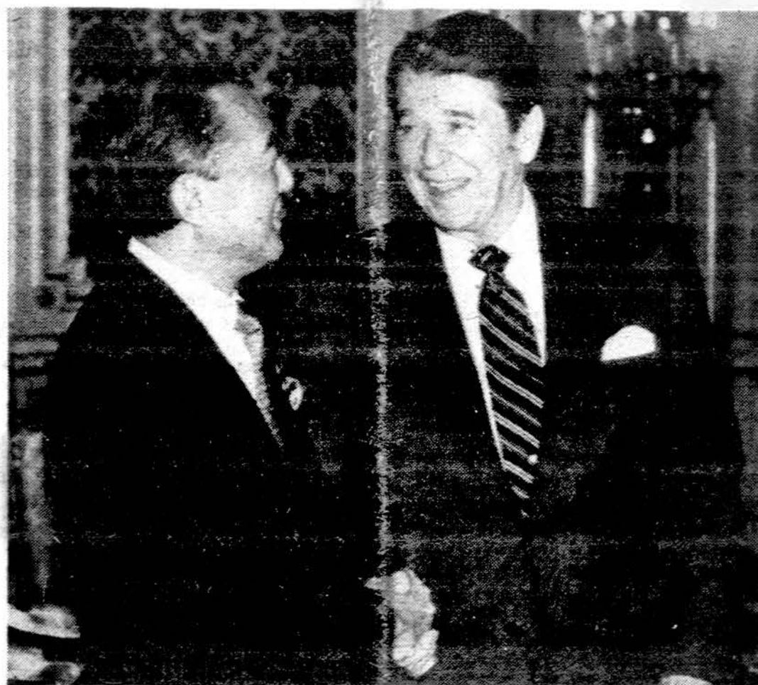
Japonijos premjeras Nakasone ir prezidentas Reagas baigia pasitarimus. Šeštadienį JAV prezidentas išvyksta į Pietų Korėją.

— Kinija paskelbė, kad iki ateinančių metų rugsėjo mėn. reikia baigti derybas dėl Hong Kongo. Jei derybos neduos vaisių, Kinija viena paskelbs savo planus. Kaip žinoma, Britanijos nuoma Hong Konge baigiasi 1997 m.