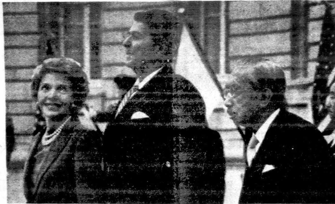
Prezidentas Reaganas grįžo iš kelionės po Japoniją ir Pietų Korėją. Nuotraukoje prezidentas Reaganas su ponia Nancy ir Japonijos imperatoriumi Hirohito.

— St. Louis dienraščiui „The Globe-Democrat“ leidėjai pasakė, kad dėl finansinių sunkumų jie sustabdo laikraščio leidimą gruodžio 31 d.