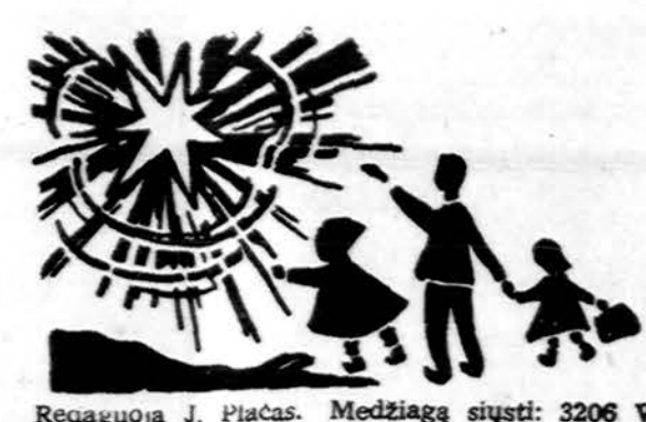
Reaguoją J. Placas. Medžiagą siųsti: 3206 W. 65th Place, Chicago, IL 60629

CHICAGOS ŽINIOS 100,000 DOL. SVIETIMUI Coca-Cola bendrovė paskyrė 100,000 dol. Chicago miesto švietimo tarybai, prašydama tai panaudoti ispanų kilmės studentams. NAUJI MOKESČIAI Chicago miesto biudžetas pramatytas 1,96 milijono dolerių, net 119 mil. dol. didesnis negu praeitais metais. Nuosavybių mokesčiai nebus keliami, bet uždedami mokesčiai nuo svaigalų, kino teatrų, automobilių lipinukų, gimimo liudijimų, skiepijimo, už laikymą jachtų, už naudojimąsi kanalizacija.