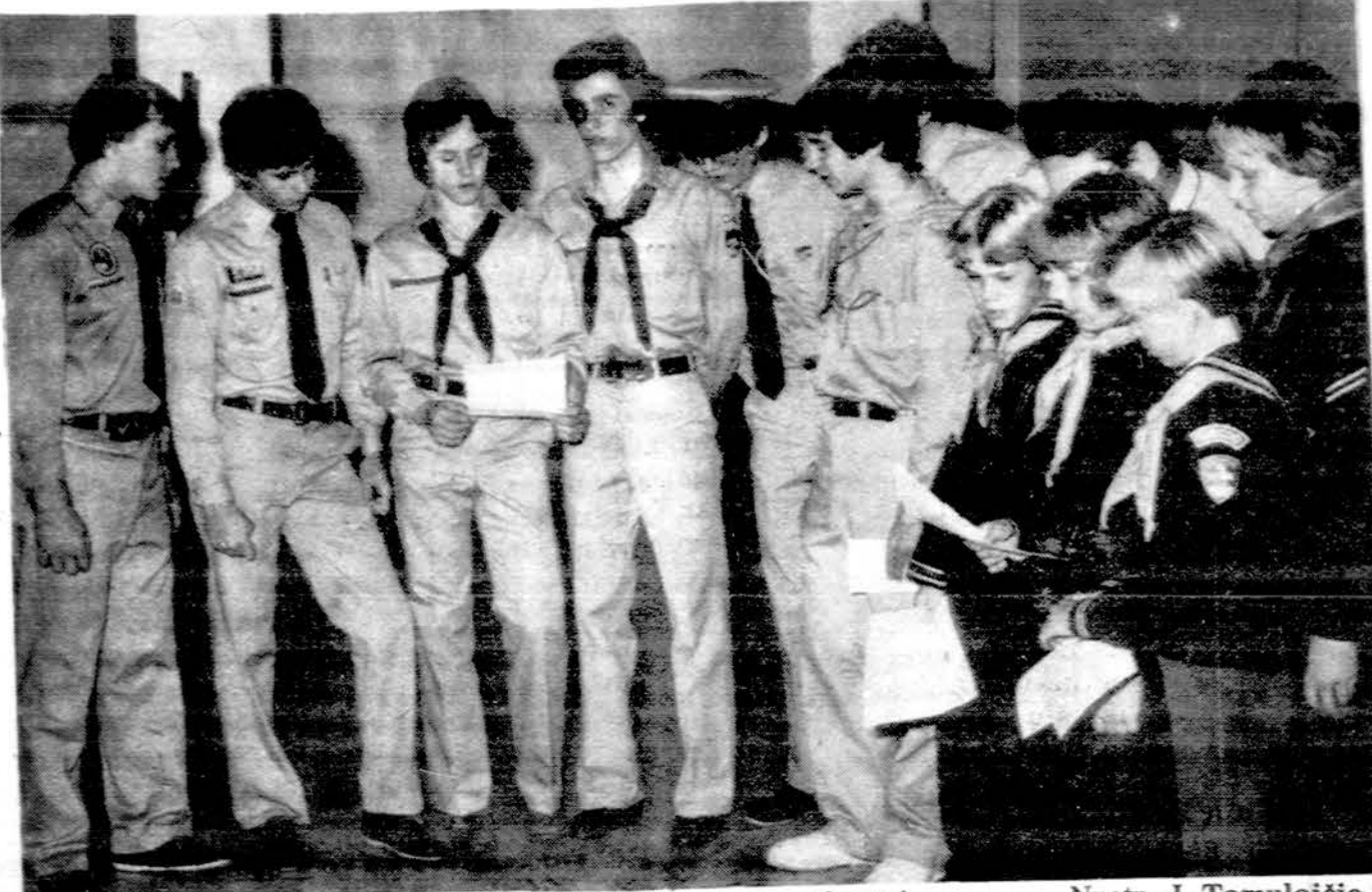
"Lituanicos" tunto sueigoje pasirodymui pasirošę jūrų skautai.