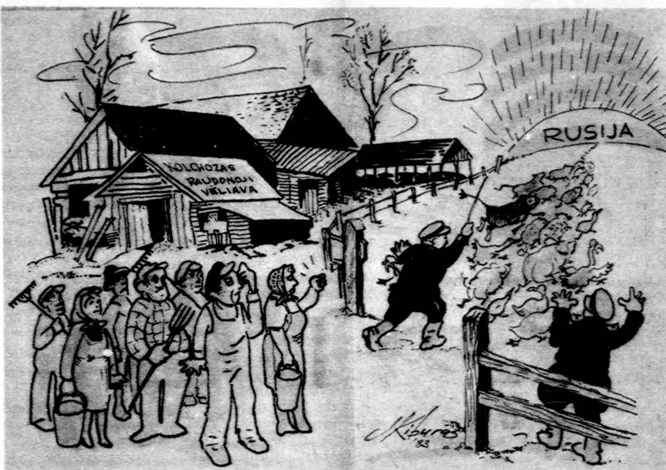
Padėkos diena pavergtoj Lietuvoj.

Tripolis. — Palestiničių jėgos, kovojančios prieš ligšolinį PLO vadą Arafatą, priartėjo Tripolyje prie PLO štabo. Kovos trumpam laikui buvo nutrauktos, tačiau vėl prasidėjo artilerijos atakos. PLO sukilėliams vadovauja buvęs Arafato rėmėjas pulk. Abu Mussa. Svarbiausias nuostolius Arafato jėgoms sukeliama Sirijos artilerija. Arafato jėgos apsuotos. Arafatas pareiškė spaudai, kad jo priešus remia ne tik sirai, bet ir Izraelis, kurio karo laivai sustabdo laivus, gabenančius į Tripolio uostą amuniciją Arafato jėgoms.