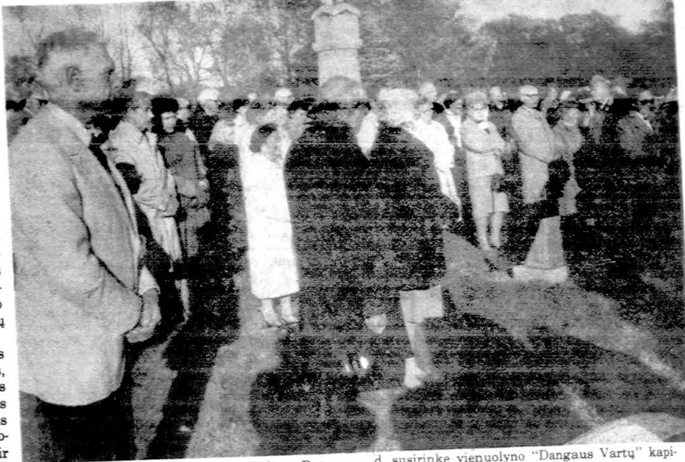
Marijos Nekalto Prasidėjimo vienuolyno Putname seselių rėmėjų dalis saskridžio metu spalio 30