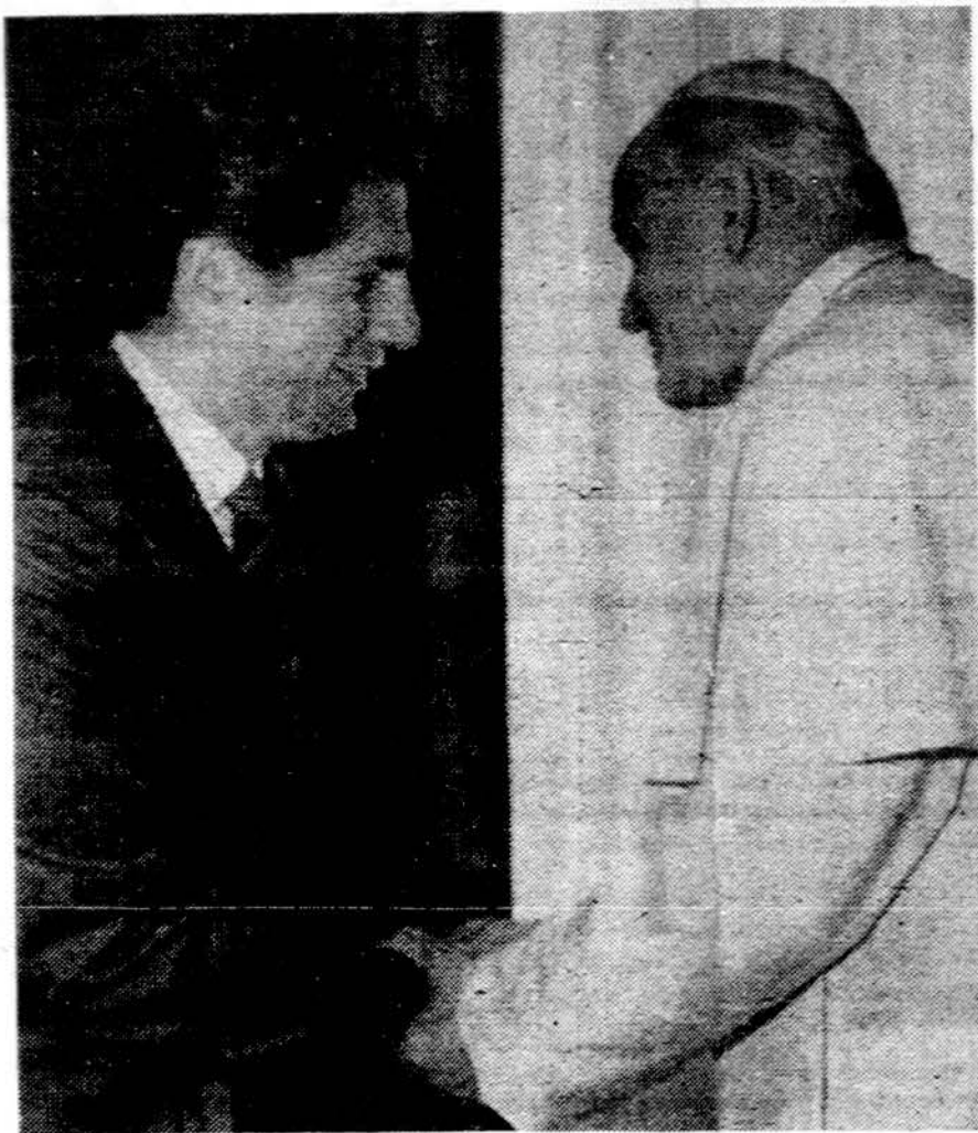
Popiežius Jonas Paulius II priėmė Vatikane Libano prezidentą Amin Gemayel ir kalbėjosi su juo 40 min. Popiežius nekartą yra raginęs katalikus melstis, kad baigtųsi Libano kančios ir sugrįžtų taika ir ramybė.

Teheranas. — Iranui karas su Iraku sudaro nemažą finansinę naštą, pripažino parlamente Irano premjeras Mousavi. Jis pasakė, kad trečdalis biudžeto išlaidų yra susijęs su karu. Šiame valstybės karo reikalams išleisdavo po 16 mil. dol. kasdien. Ateinančiais metais išlaidos sieks po 11 mil. dol. kasdien. Iranas atmetė Jungtinių Tautų rezoliuciją Nr. 540, kuri reikalauja visišką laisvę laivų judėjimui Persų įlankoje ir ją liečiančiuose vandens keliuose, įskaitant svarbų Irako naftos uostą Basrą. Šis uostas ir upės Shatt al Arab žiotys jau nuo karo pradžios Irano užblokuotos. Irakas negali siųsti iš to uosto savo naftos. Todėl Irako lėktuvai ėmė pulti visus prakinčius laivus, plaukiančius į Irano uostus, išskyrus Kharğ salą, kuri yra toliau nuo Irako.