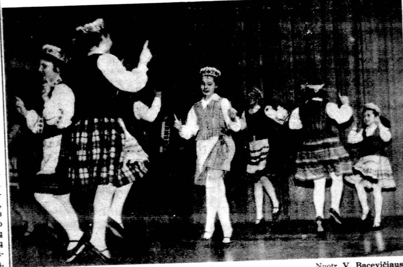
Clevelando „Grandinėles“ jauniausios šokėjos.

Švenčiausias Jėzus Širdies katalikų universitetas Romoje šiomis dienomis pakvietė žmonių meilės apaštalę Motiną Teresę iš Kalkutos susitikimui su medicinos fakulteto studentais. Ta proga Motina Teresė, kuri yra šio universiteto medicinos garbės daktarė, atsakydama į studentų klausimus, apibrėžė jos turimą krikščionio gydytojo sąvoką. Gydytojo profesija, pažymėjo ji, nėra paprasta profesija, bet yra pašaukimas. Tai pašaukimas palengvinti savo sergančiųjų brolių kančias. Gydytojo profesija yra šventa, nes palengvindamas ligonio kančią, jis daro tai, ką pats Kristus darė. Dėl to nepakanka verstis gydytojo profesija vien už atlyginimą. Kiekvienas gydytojas turi įsisąmoninti, pažymėjo Motina Teresė, kad padėdamas sergantiesiems, jis tarnauja pačiam Kristui.