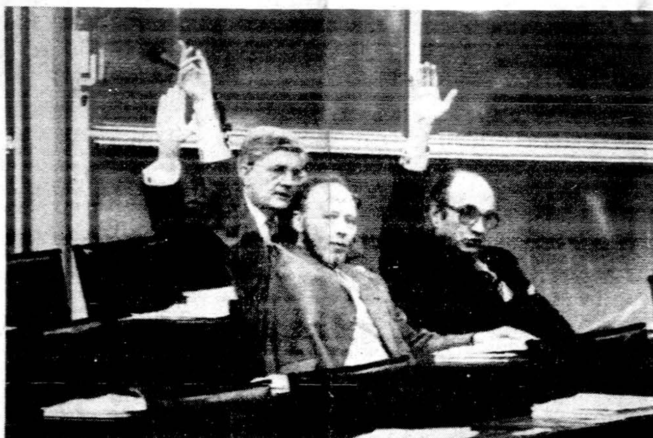
Vakarų Vokietijos parlamentas nutarė atimti imunitetą iš ekonomikos ministro grafo Otto Lambsdorffo. Nuotraukoje už imuniteto atšaukimą balsuoja parlamento nariai.

Rinkos biudžetas siekia 21 bil. dol. Didelės subsidijos ūkininkams, ypač, Prancūzijoje ir Vakarų Vokietijoje, suėda didelę biudžeto dalį. Šiemet Rinkos išdą ištuštėjo spalio mėn., o ateinančiais metais jis gali likti tuščias rugpjūčio mėn. Žemės ūkiui iki