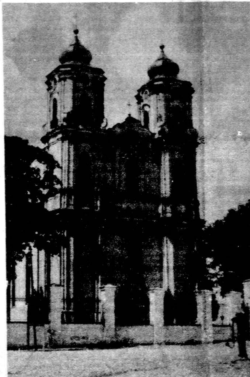
Seinų miesto bazilika, kur po ilgų kovų lietuviai gavo teisę melais lietuviškai. Pamaldos lietuvių kalba prasidėjo spalio mėn. Lomžos vyskupas ieško pastovaus lietuvių kunigo, kuris čia dirbtų su Seinų lietuviais.

— Portugalijoje potvyniuose žuvo šeši žmonės, daug liko be pastogės.