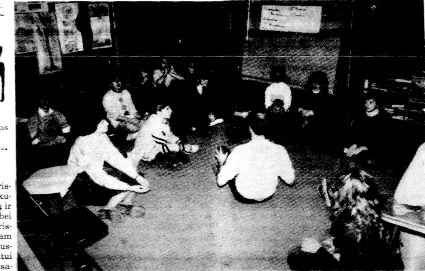
Toronto moksleiviai ateitininkai diskutuoja.

Siam likusiam Advento laikui palikim triukšmingą dainą, aistringą šokį, pramogą. Sustokim ir išgirskim Advento varpus. Mūsų sielos ilgesys atves mus prie Kristaus, gyvenimo laimės, kurios ilgamės. Ir Kristaus Kūdikėlio žavingas šypsniš gražins mums gyvenimo prasmę ir suteiks tikrąjį Kalėdų džiaugsmą! Už laiką, kurį Jam čia žemėje aukosim, Jis dovanos laimingą amžinybę, už blogį, kurio dėl Jojo atsisakysim, Jis papuos mus dieviškąja palaima, už pilkos kasdienos baimingą rūpestį šventa Kalėdų ramybe, kurią skelbia angelai.