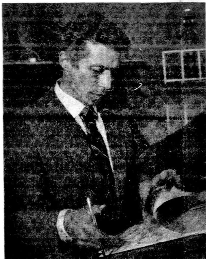
Salvadoro konstitucinės asamblėjos pirmininkas Roberto d'Aubuisson pasirašo naują valstybės konstituciją, jau 36-tą nuo 1824 m. Nacionalistų partijos vadovas d'Aubuisson savo partijos buvo išrinktas kandidatu į prezidento vietą. Salvadoro prezidentas bus renkamas kovo mėn.

tėra atdidarytos, viena seniausia bažnyčia — Šv. Kazimiero šventovė — yra paversta ateistiniu muziejumi. Tačiau, toliau pažymi vokiečių televizijos komentatorius, nors Bažnyčia Lietuvoje yra persekiujama kaip niekur kitur pasaulyje, ji tebėra gyva, jos įtaka labai didelė. Ateistams nepavyko jos nugalėti, nes tautoje ji yra įleidusi tokias gilias šaknis, kaip jokiam kitame komunistų valdomame krašte. Komentatorius atkreipia dėmesį, kad daugiau negu 70 procentų jaunavedžių tuokiasi bažnyčiose, labai aukštas procentas tikinčiųjų reguliariai lanko bažnyčią. Komentatoriui kalbant, televizijos ekrane buvo rodoma, kaip žmonės meldžiasi prie Aušros Vartų Dievo Motinos šventovės, gausiai dalyvauja pamaldose Šv. Petro ir Povilo bažnyčioje, Sekminių procesijoje aplink bažnyčią, nes už šventoriaus ribų draudžiama procesijai išeiti. Vakarų Vokietijos dokumentinį filmą apie religinį gyvenimą sovietų valdomuose kraštuose stebėjo apie 8 milijonai žiūrovų, ne tik Vakarų Vokietijoje, bet ir kaimyniniuose kraštuose.