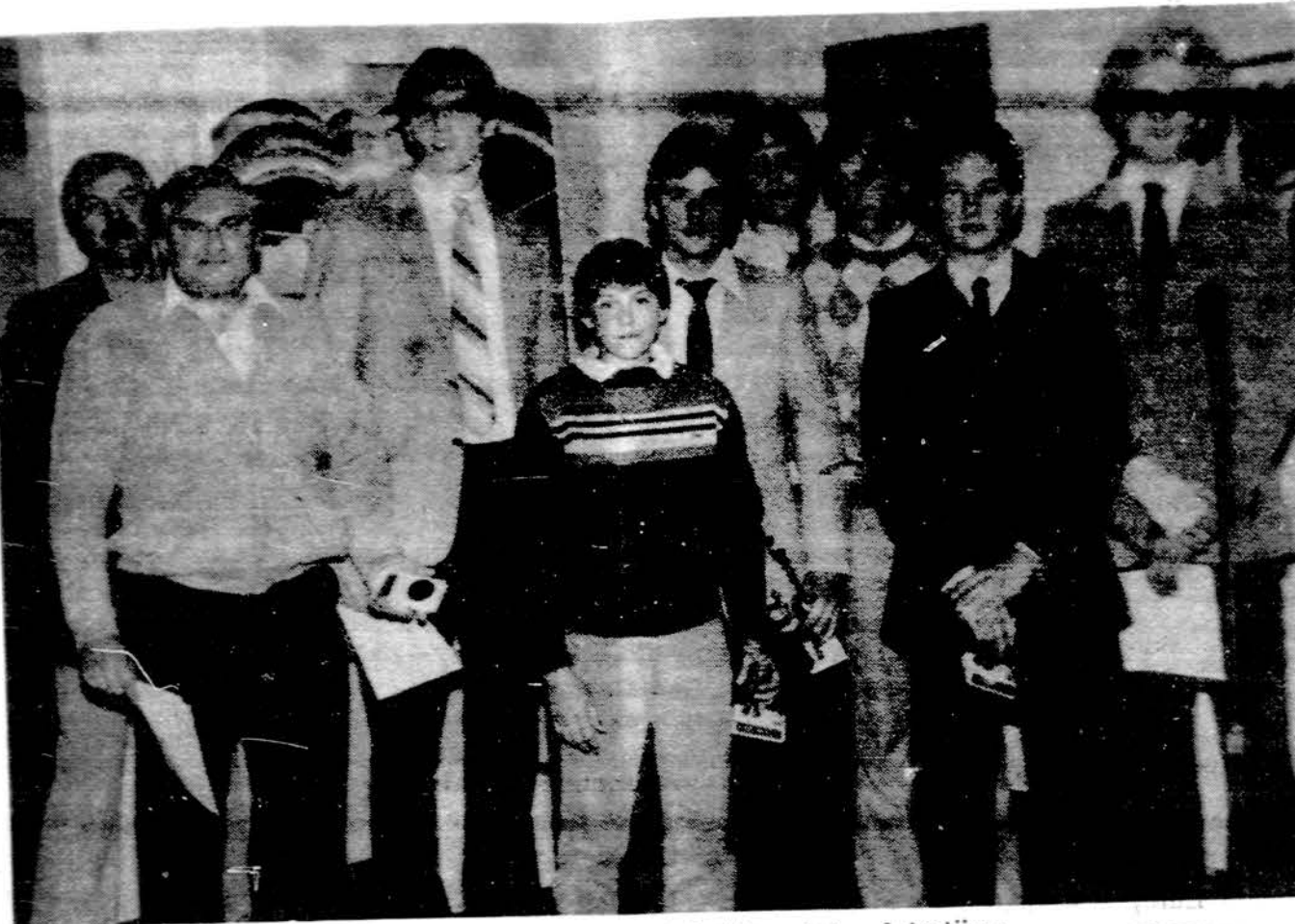
Mes laimėjome... — Sportininkai ir vadai po laimėjimo.