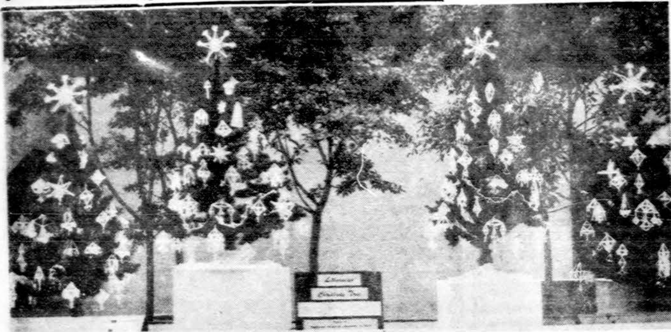
Lietuviškos eglutės Clevelando teisingumo rūmuose.