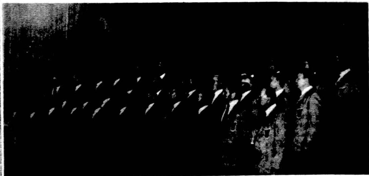
Toronto vyrų choras „Aras“, vadovaujamas muz. V. Verikacio, atlieka programą Hamiltone, Lietuvos Kariuomenės šventės minėjime.