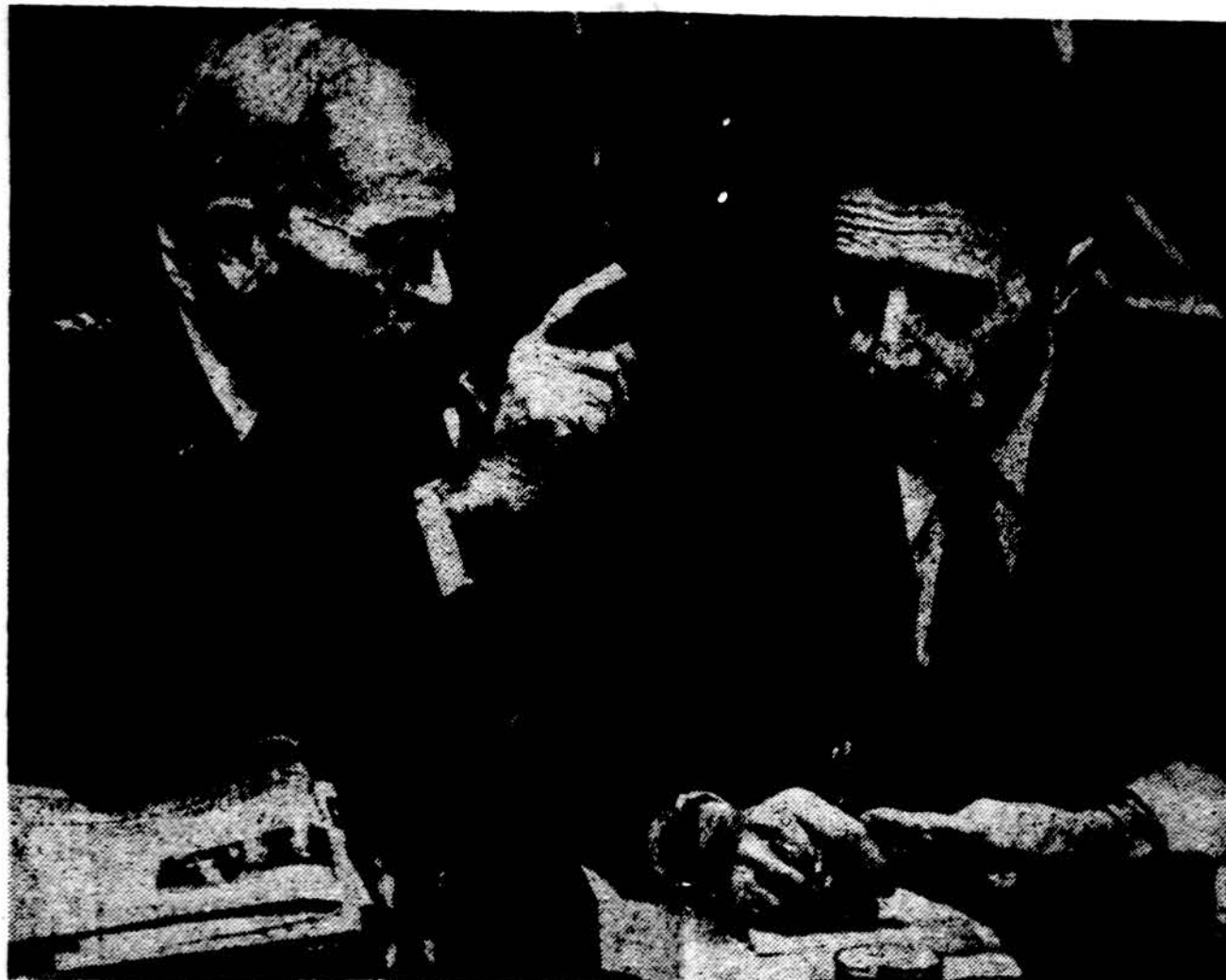
Du svarbiausieji JAV gynybos vadai: Jungtinio kariuomenės štabo viršininkas gen. John Vessey ir gynybos sekretorius Caspar Weinberger svarsto problemas. Amerikoje vis dažniau reikalaujama išvežti iš Libano ten nusiųtus

— Kinijos valdžia skelbia, kad nusikaltimai Kinijoje sumažėjo 50 nuol. Pravedus stiprią kampaniją, pradėjus vykdyti viešas mirties bausmes, nusikaltimų skaičius nukrito.