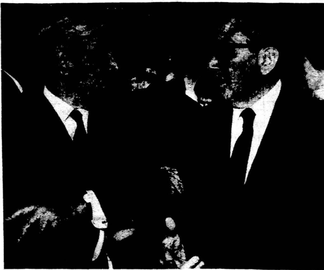
Buvęs Vakarų Vokietijos kancleris Helmut Schmidt ir buvęs valstybės sekretorius Henry Kissinger susitiko Briusely, kur Georgetown universiteto tarptautinių studijų centras suorganizavo seminarą apie NATO ateitį ir pasaulio saugumo klausimus. Seminare paličiami ir NATO valstybių nesutarimai bei jų priežastys.

Maskva. — Sovietų Tass agentūra paskelbė, kad Sovietų Sąjunga, pasitarusi su Angolos ir Kubos vyriausybėmis, nutarė sustiprinti Angolos gynybą, teritorinį neliečiamumą ir nepriklausomybę. Angolai parama padidinama ryšium su Pietų Afrikos respublikos puldinėjimais. Jie vykdomi gavus Amerikos paramą ir pritarimą, rašo Tass. Sovietų spauda plačiai rašo apie Angolos armijos pergales prieš „banditus“ — Unita grupę, kuri siekia visišką Angolos nepriklausomybę.