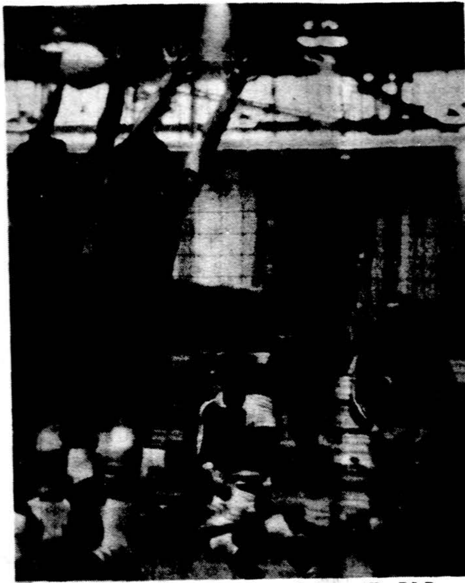
Australijos tinklininkai blokuoja bostoniečių smūgį II-se P.L.D. sporto žaidynių rungtynėse.