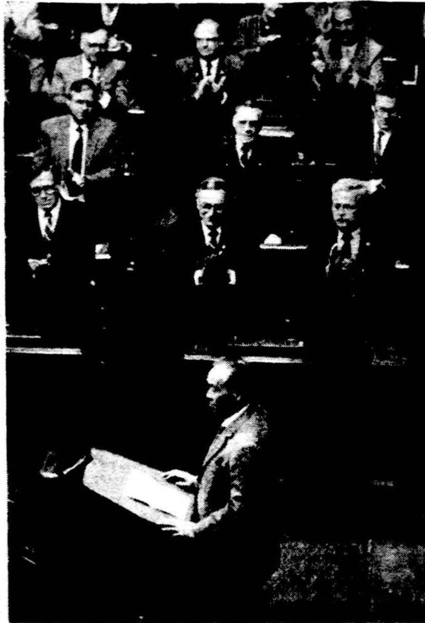
Pirmą kartą istorijoje Kanados parlamente kalbą pasakė Kinijos premjeras. Jungtinėje parlamento sesijoje premjeras Zhao Ziyang kalbėjo apie branduolinio karo grėsmę žmonijai ir pagyrė Kanados premjerą Trudeau už jo žygius suorganizuoti branduolinius ginklus turinčių valstybių vadų konferenciją.

— Dvi bombos sprogo arabų Betanijos kaime, netoli Jeruzalės. Sužeistas musulmonų valdasis ir graikų ortodokso vienuolė. Izraelio karinei įgaliui buvo pranešta, kad bombas susprogdino žydų TNT organizacija (Terror against terror).