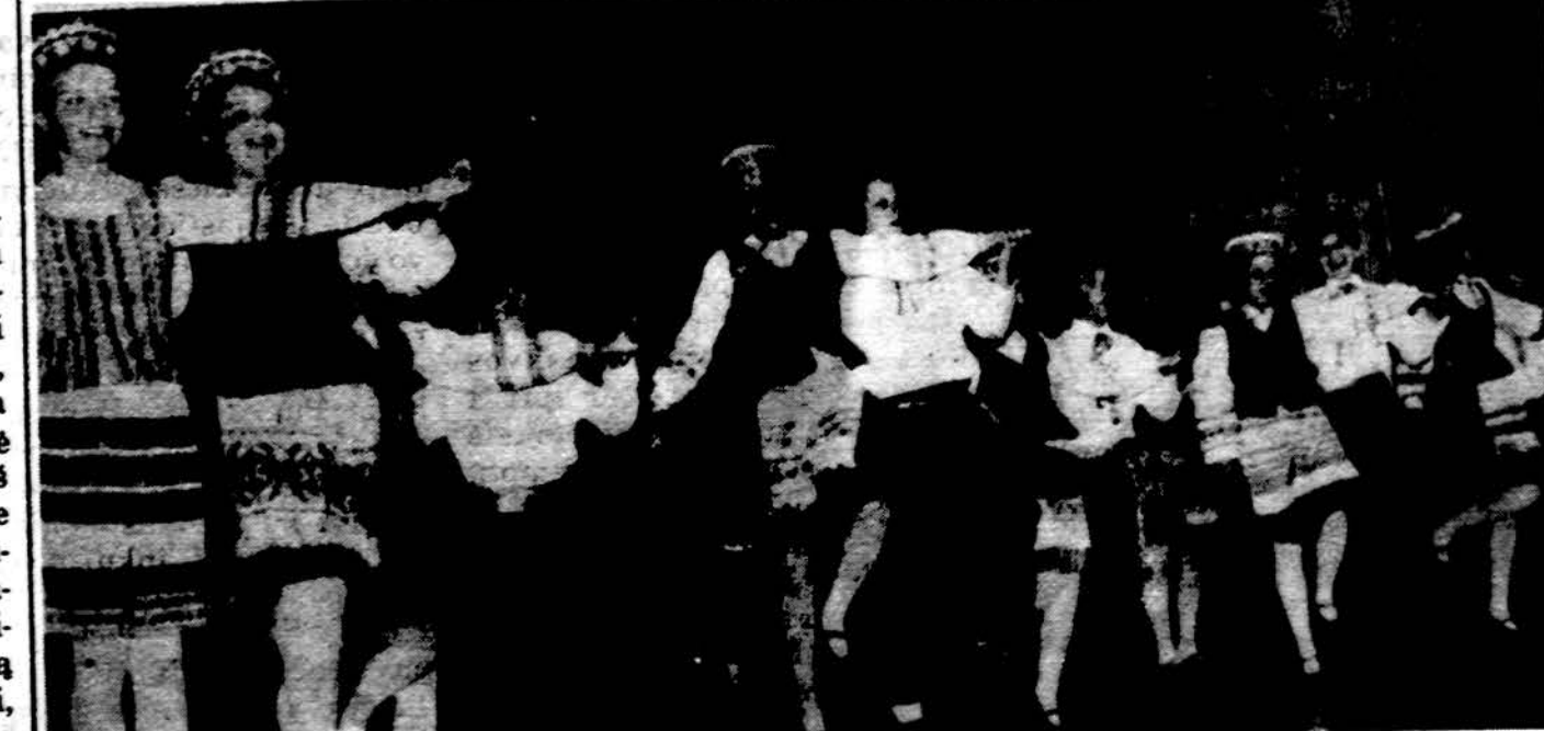
„Grandinėles“ jauniausieji šoka Clevelando Dievo Motinos parapijos salėje.