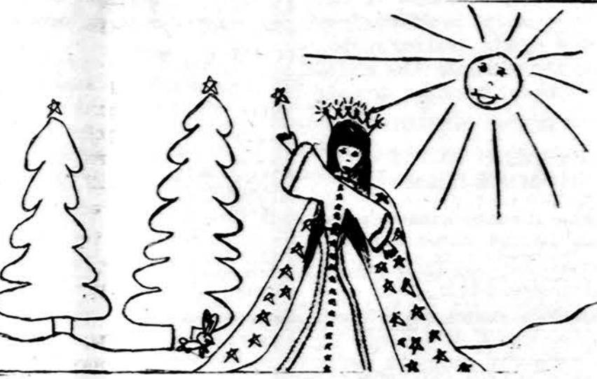
"Sniego Karalaitė" Piešė Rima Jeimantaitė, Charlotte, N. C.

Isteigtas Lietuvių Mokytojų Sąjungos Chicago's skyriaus