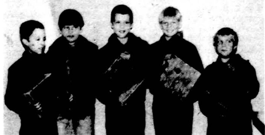
"Pilėnų" tunto vilkiukai Clevelande pasiruošę sutikti pavaršarį ir sugrįžtančius paukštėlius.