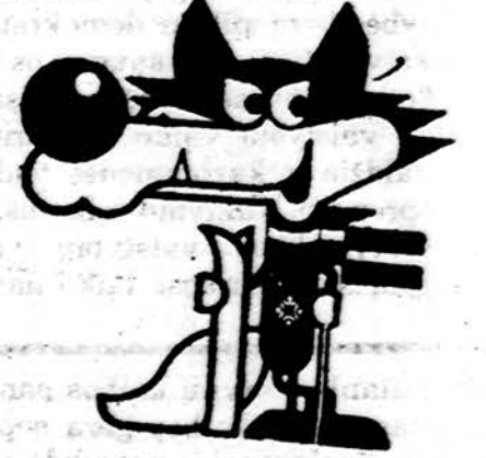
"Vučka" — žiemos sporto olimpiados Sarajeve ženklas.