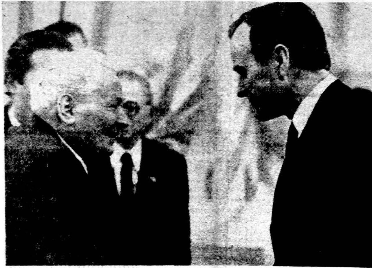
Viceprezidentas George Bush Maskvoje susipažino su naujuoju sovietų vadu Konstantinu Černenka. Pasulyje daug rašoma apie atsiradusią naują progą pagerinti Rytų-Vakarų santykius.

Daugiau patyrę komentatoriai teigia, kad komunizmo tikslai nesikeičia, keičiasi tik asmenys ir metodai tų tikslų siekiant.