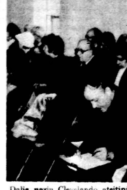
Dalis narių Clevelando ateitininkų sendraugių susirinkime.

Clevelando sendraugiai kaip organizacija ir individualiai aktyviai dalyvauja Clevelando parapijų veikloje, (prisideda prie sekmadienio kavinių ruošimo, dalyvauja liturginėje veikloje ir t. t.), bei dirba įvairiose organizacijose. Stengiasi įtraukti į ateitininkišką veiklą ir jaunesnius žmones, kadais aktyvius moksleivius ir studentus, dabar paskendusius savų jaunų šeimų rūpesčiuose. Kai kurie