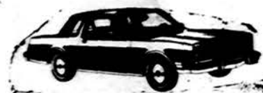
Chrysler LeBaron Medallion

KURIAM GALUI MOKĖT DAUGIAU? PIRKDAMI NAUJUS AR VARTOTUS AUTOMOBILIUS SUTAUPYSITE NUO $300 IKI $1,000