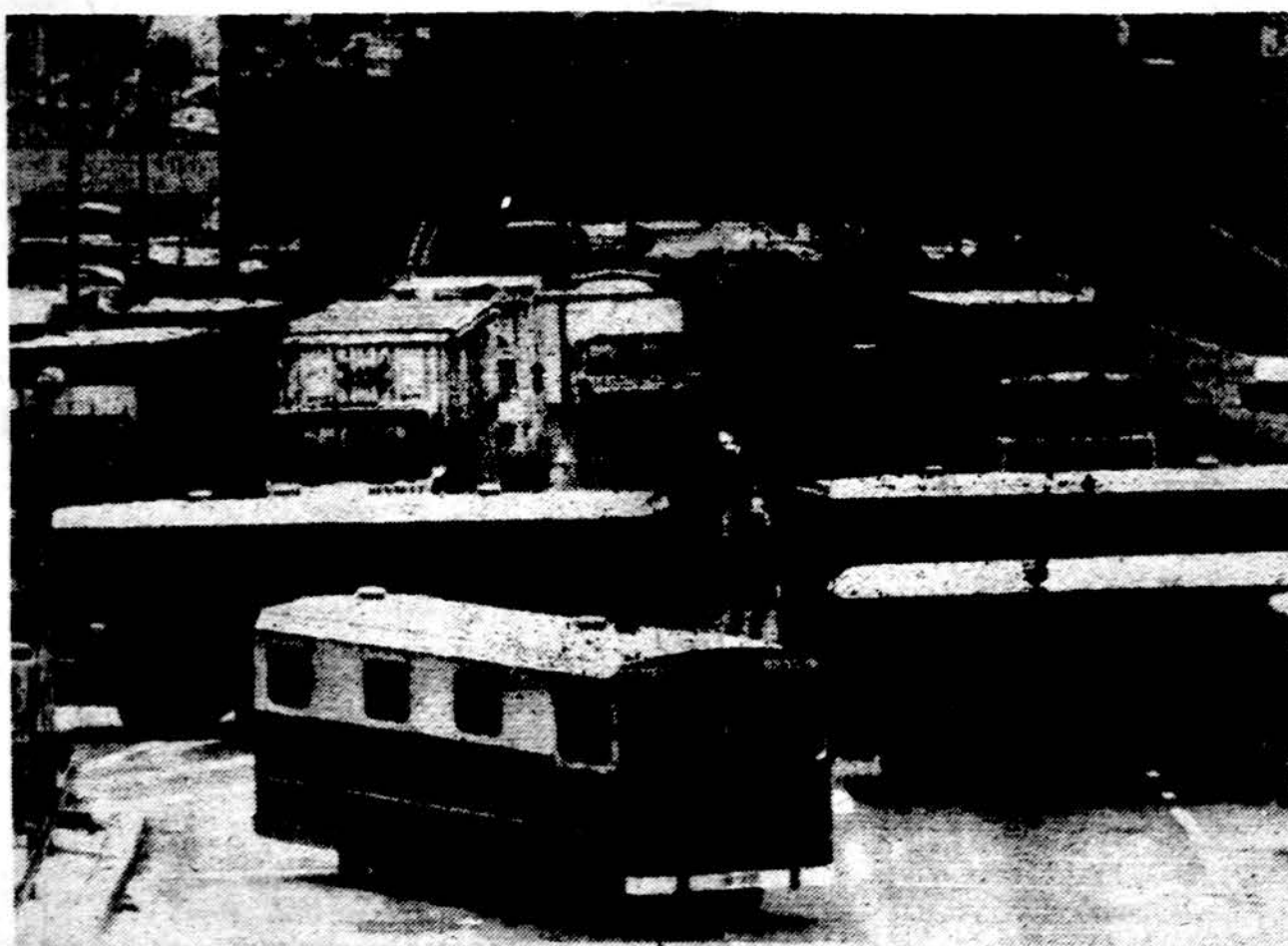
Prancūzijoje išsiplėtė sunkvežimių vairuotojų streikas. Jie ne tik nutraukė darbą, bet ir užblokavo visus didesnius vieškelius, pastatydami vidury kelio savo mašinas. Del žaliavų stokos fabrikai sustabdė darbus, apie 38,000