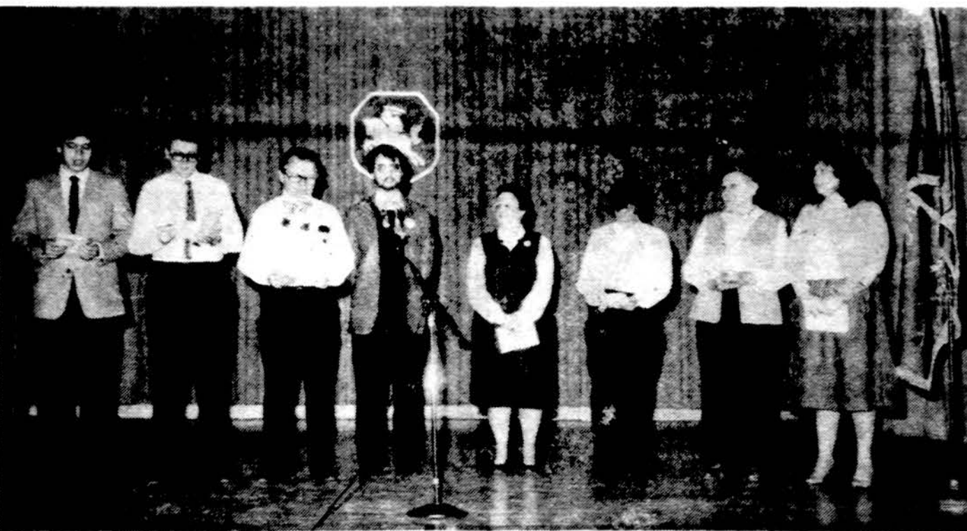
Kr. Donelaičio suaugusiųjų klasė, kuri mokosi liuanistikos kalbos. Jie atlieka programą liuanistikai Vasario 16-tos minėjime.