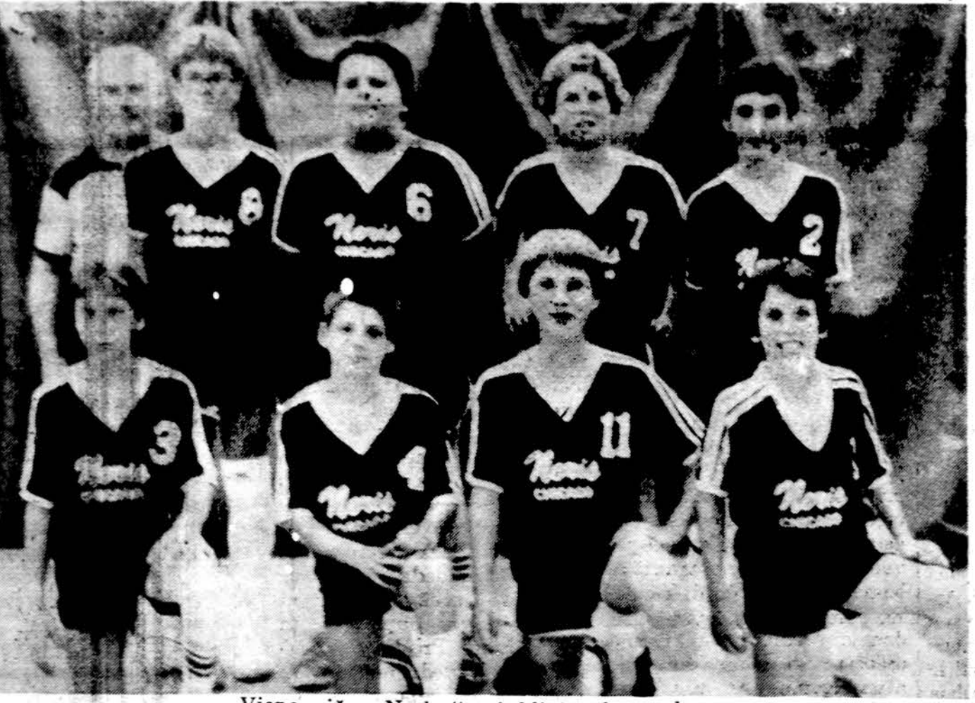
Viena iš „Neries“ tinklinio komandų