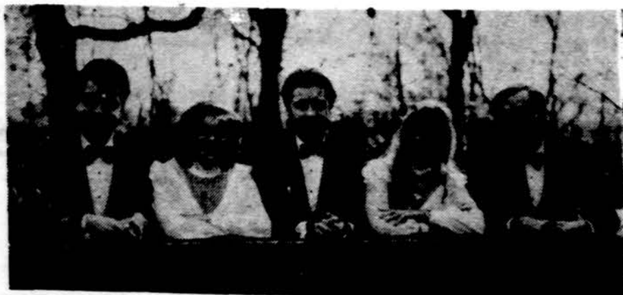
New Yorko "Harmonijos" dainininkai, pasirodę dainuoti Washingtono lietuviams.