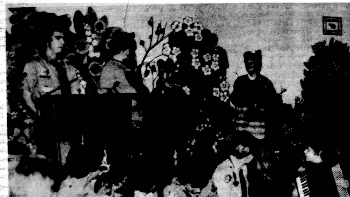
"Meškiukas Rudnosiuokas" Clevelando skautų tėvų komiteto ruoštame blyū baliuje.