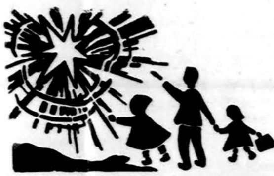
Redaguoja J. Plačas. Medžiagą siūsti: 3206 W. 65th Place, Chicago, IL 60629

Vasario 16 d. mamytė su klientomis moterimis, pasipuošusios tautiniais drabužiais, nuvažiavo pas apskrities komisierius gauti proklamaciją. Vasario 19