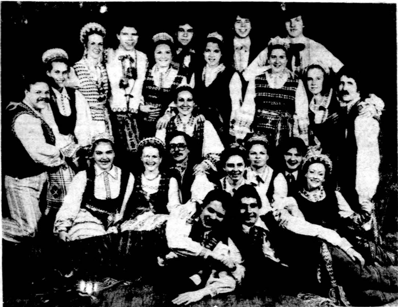
Vytauto Didžiojo šaulių rinktinės tautinių šokių grupė „Vytytis“