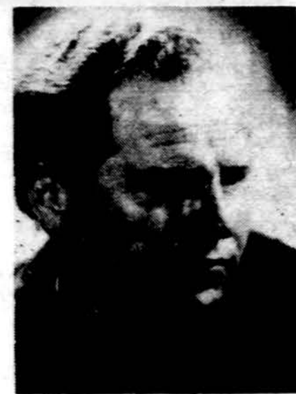
AKTORIUS IR DAILININKAS