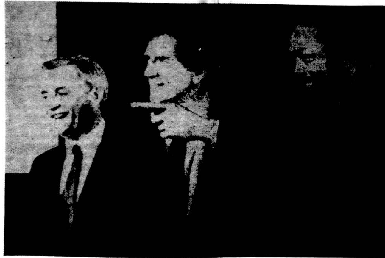
Chicagoje sekmadienį įvyko trijų demokratų, vavov: buvęs viceprezidentas Walter Mondale, kandidatų į prezidento vietą, debatai. Juose dalyvavo: sen. Gary Hart ir pastorius Jesse Jackson.

Šalia patių libaniečių interesų, Libane labai daug reikalauja Sirijos ir Izraelio interesai. Sirijos įtaka Libane nemažė. Nepriklausomas Kuwaito laikraštis su ryšiais Sirijoje paskelbė, kad po sovietų politbiuro nario Geidar Alijevo vizito Sirija tikisi gauti iš Maskvos patių mo-