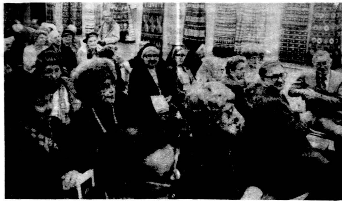
Lietuvių Tautodailės parodoje Cicerio, Ill.