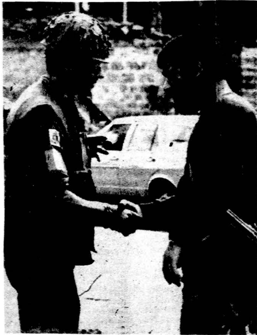
Is Libano šią savaitę išvažiuos paskutinieji Prancūzijos kariai, dalyvavę tarptautiniuose taikos priedžiūros daliniuose. Pirmą pasitraukė britai, po jų italai, amerikiečiai. Nuotraukoje prancūzas kareivis atsisveikina su libaniečių musulmonu, kurio dalinys perims prancūzų pozicijas Beirute.

Maskvoje kalbama, kad šiais Amerikos rinkimų metais sovietai nieko nedarys, kas galėtų padėti Reaganui laimėti rinkimus. Maskvos komentatoriai, anksčiau įsitikinę, kad Reaganas tikrai bus perrinktas, dabar susidomėję stebi senatoriaus Harto iškilimą. Jie mano, kad