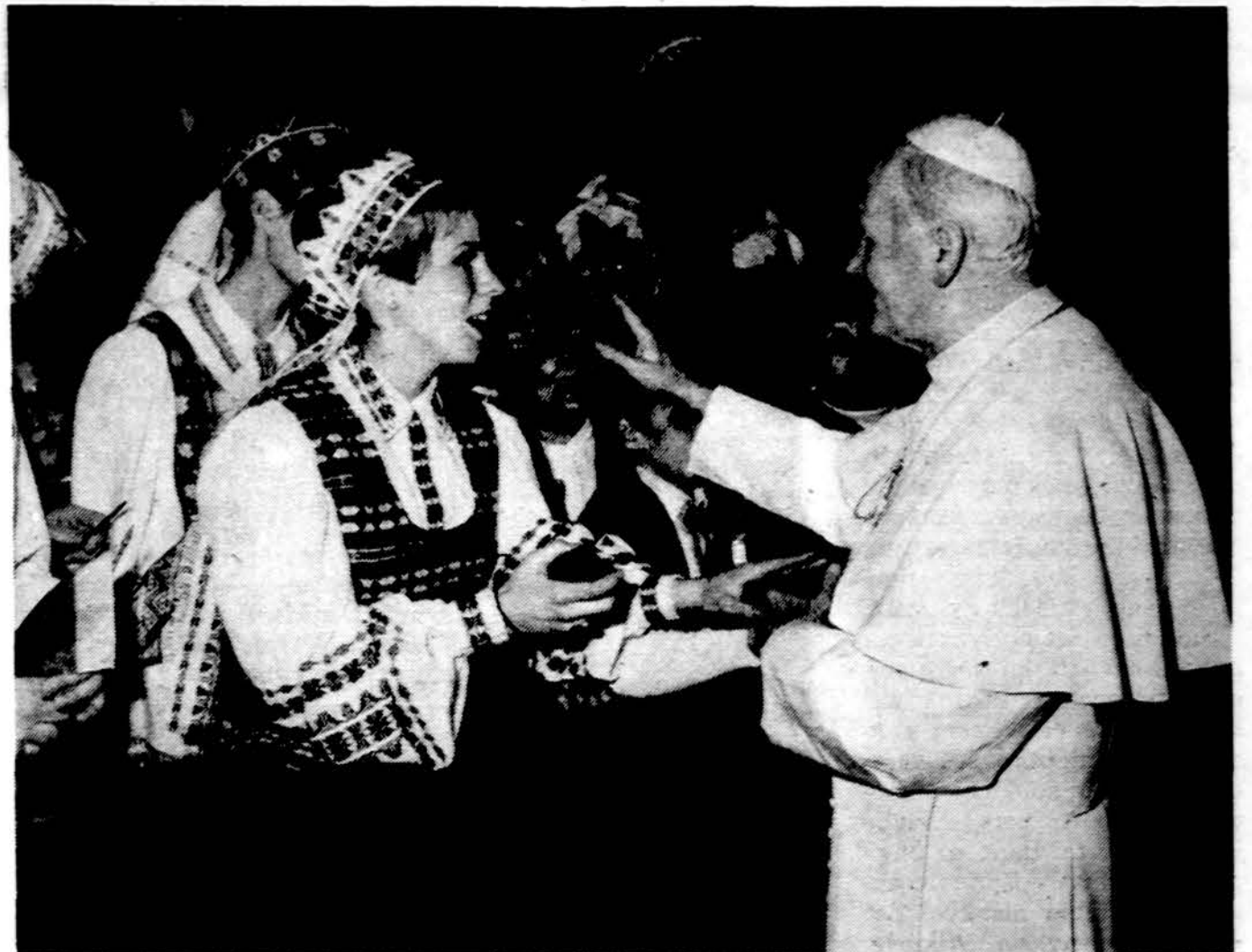
Šv. Tėvas Jonas Paulius II su Grandinėlės jauni mu audiencijos metu kovo 3 d. Vatikano rūmuose.