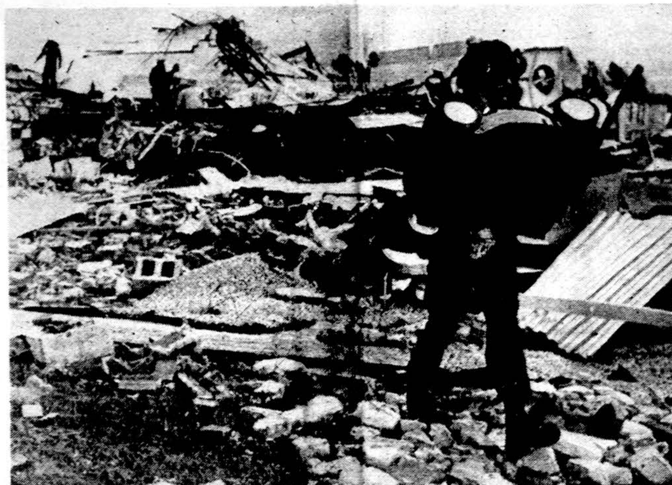
Pietinės Karolinos miesto Bennettsville prekybos centro nuotrauka po galingo uragano. Kareiviai neša žolę pjauti mašiną, rastą griuvėsiuose.