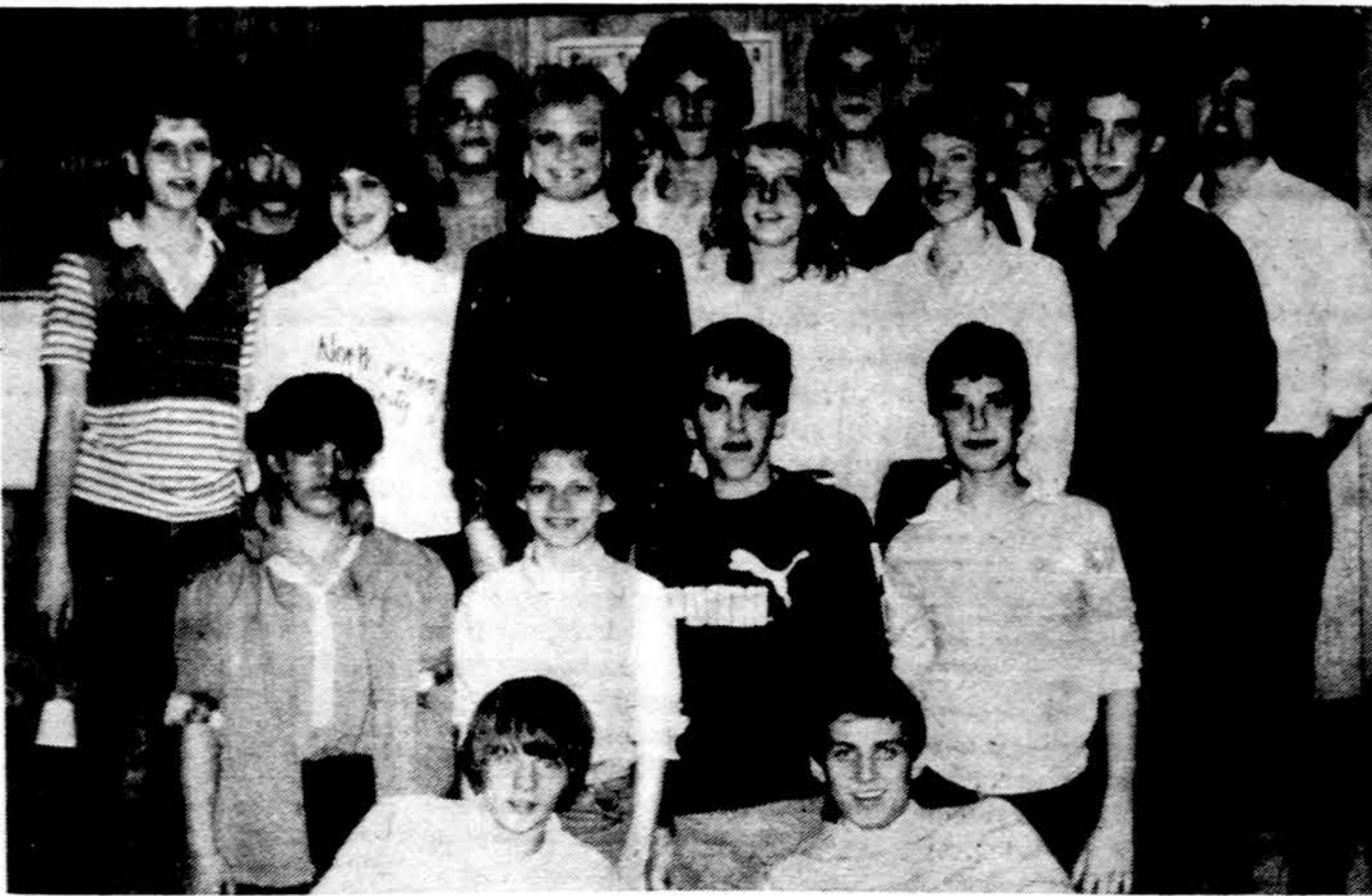
Prez. A. Stulginskio ateitininkų moksleivių kuopos dalis narių.