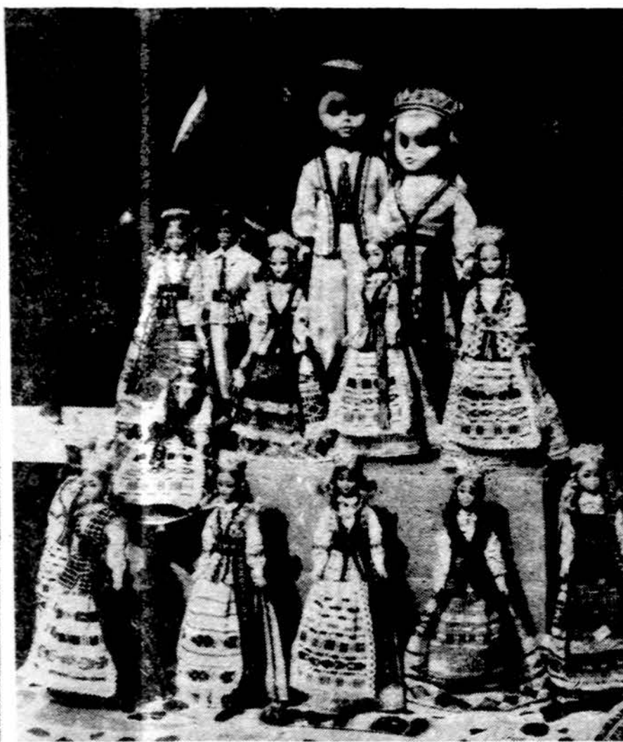
Lietuviškos tautos Los Angeles skautų Kaziuko mugėje 1984 m. kovo 11 d.

Isteigtas Lietuvių Mokytojų Sąjungos Chicago skyriaus