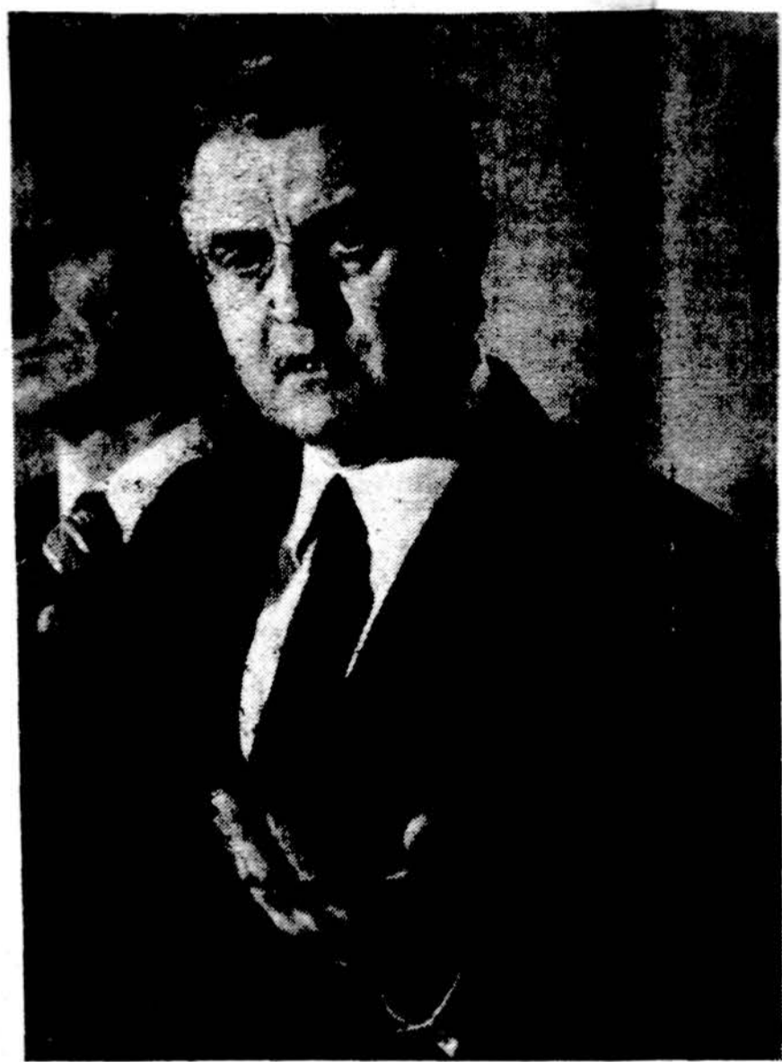
Buvęs viceprezidentas Walter Mondale antradienį užtikrintai laimėjo demokratų pirminius rinkimus New Yorko valstijoje. Ateinančią savaitę jis tikisi laimėti balsavimus Pensilvanijoje.

Filipinų žuvusio opozicijos vado Aquino našlė ragino filipiniečius balsuoti rinkimuose, tačiau įspėjo vyriausybę, kad jei rinkimai bus sukurti, krašte kils smurto veiksmai.