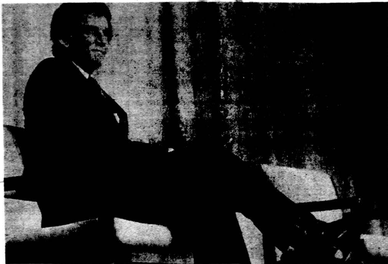
Senatorius Gary Hart (dem. iš Colorado) pralaimėjo Pensilvanijos demokratų pirminius rinkimus. Nepadėjo nė jo mėgiami kaubojiški batai.