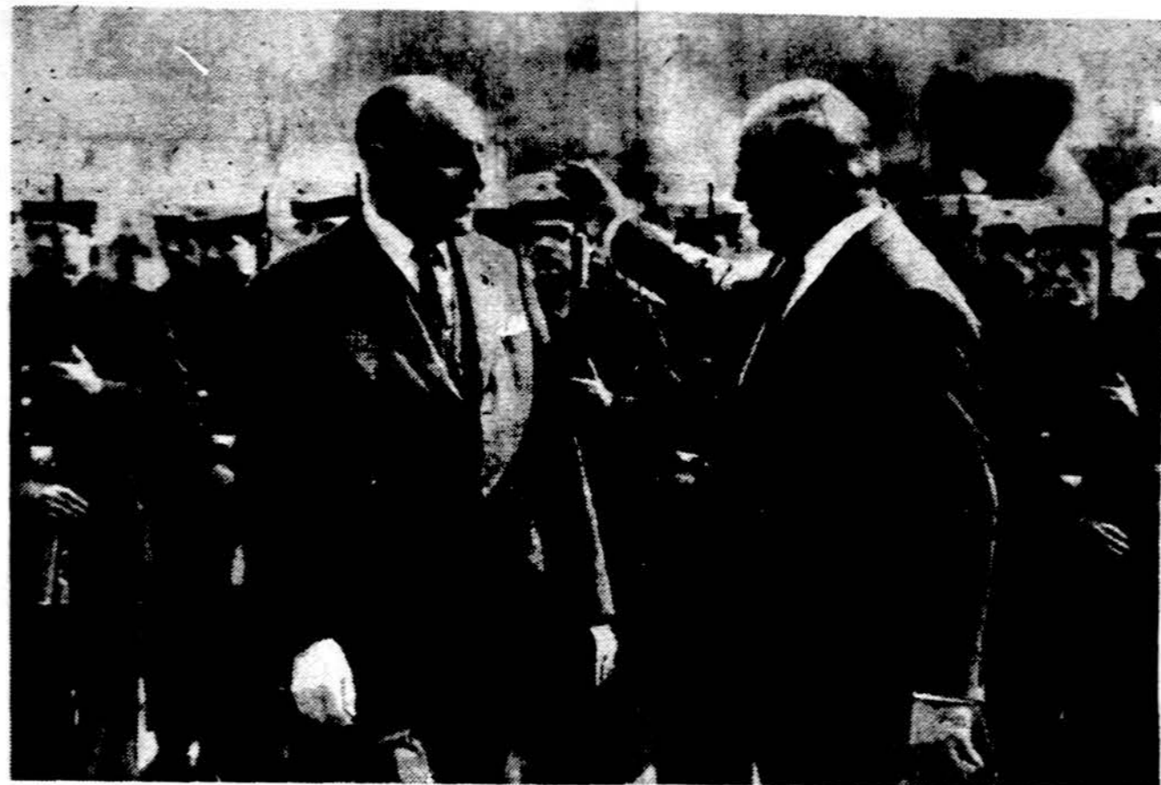
Ilgametis NATO generalinis sekretorius Joseph Luns (kairėje) atvyko į Boną atsiveikinti su Vakarų Vokietijos kancleriu Helmut Kohl. Nauju sekretoriumi bus buvęs Britanijos užsienio reikalų ministeris lordas Carringtonas.