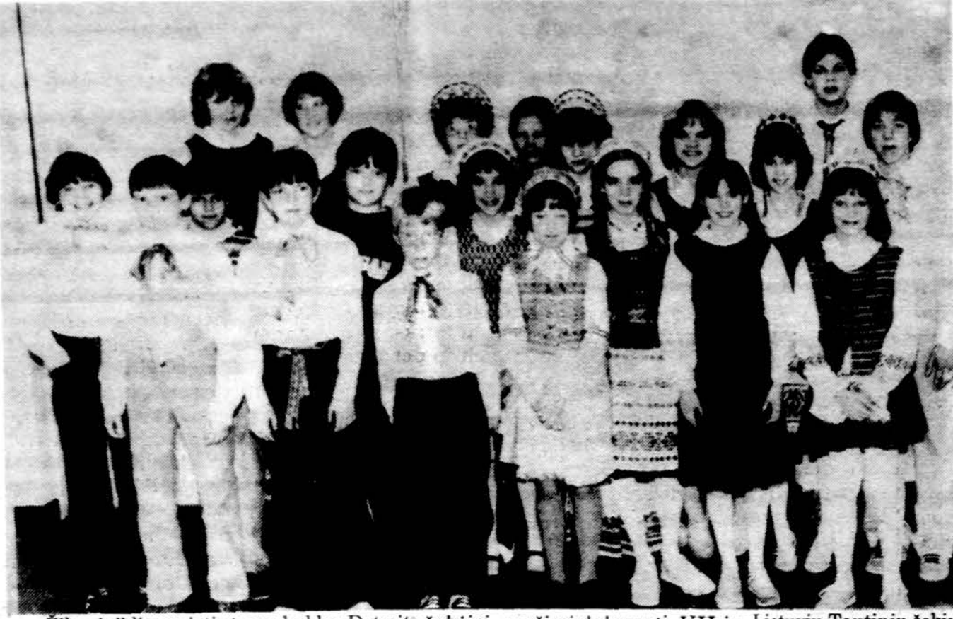
„Žiburio” lituanistinės mokyklos Detroitie šokėjai ruošiasi dalyvauti VII-je Lietuvių Tautinių šokių šventėje.