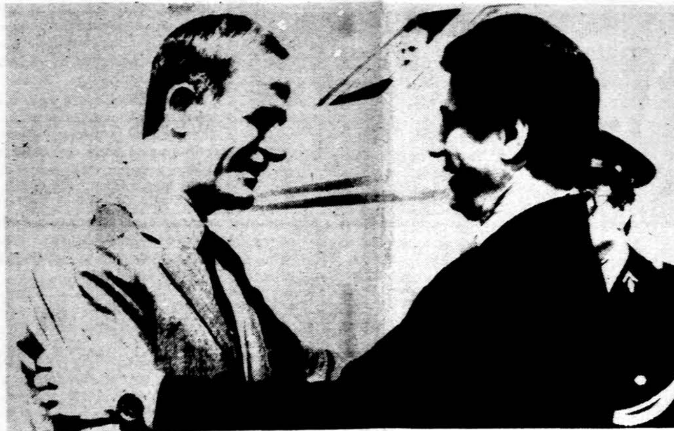
Sirijos prezidentas Hafez al Assad šiltai priėmė Libano jauną prezidentą Amin Gemayel, kuris sutiko duoti daugiau valdžios vietų Libano musulmonams.

— Karibų jūroje prasidėjo didesni JAV kariuomenės manevrai. Tarp numatytų pratimų yra ir 300 jūros laivyno personalo šeimų narių evakuacija iš Guantanamo įlankos, Kuboje esančios JAV bazės. Manevrai tęsis iki gegužės 6 d. — Indijos Bengalijos pasienyje įvyko susisaujimas. Abi pusės kaltina viena kitą. Indija nutarė pastatyti pasienyje spygliuotų vielų sieną, kuri užkirstų kelią į Indiją atbėgantiems bengalams.