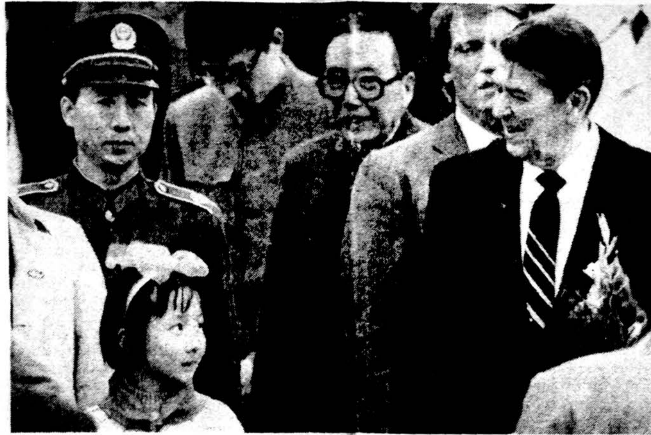
Pirmasis prezidento Reagano susitikimas Kinijos žemėje buvo su maža mergaite, kuri jam ieteikė puokštę gėlių. Vidury (su akiniais) stovi Kinijos užsienio reikalų ministeris Wu Xueqian.

Balandžio 12 d. į didįjį Romos stadioną — Foro Italico — entuziastingų ovacijų sutiktas atvyko popiežius Jonas Paulius II. Stadionas talpina daugiau negu šimtą tūkstančių žmonių. Susitikimo su popiežium metu visos stadiono vietos buvo užimtos. Prie