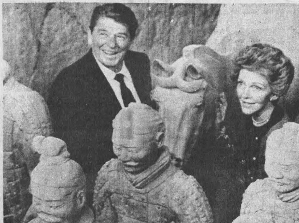
Prezidentas Reaganas su p. Nancy Reagan Kinijoje aplankė archeologines iškasenas prie pirmojo imperatoriaus Qin Shi Huang kapo. Aplink kapą, prieš 10 metų netikėtai buvo rasta ištisa

armija užkastų kareivių, jų žirgų statulų. Jau atkasta 800 statulų, tačiau archeologai dar tikisi rasti jų 8,000. Imperatorius mirė prieš 2200 metų.