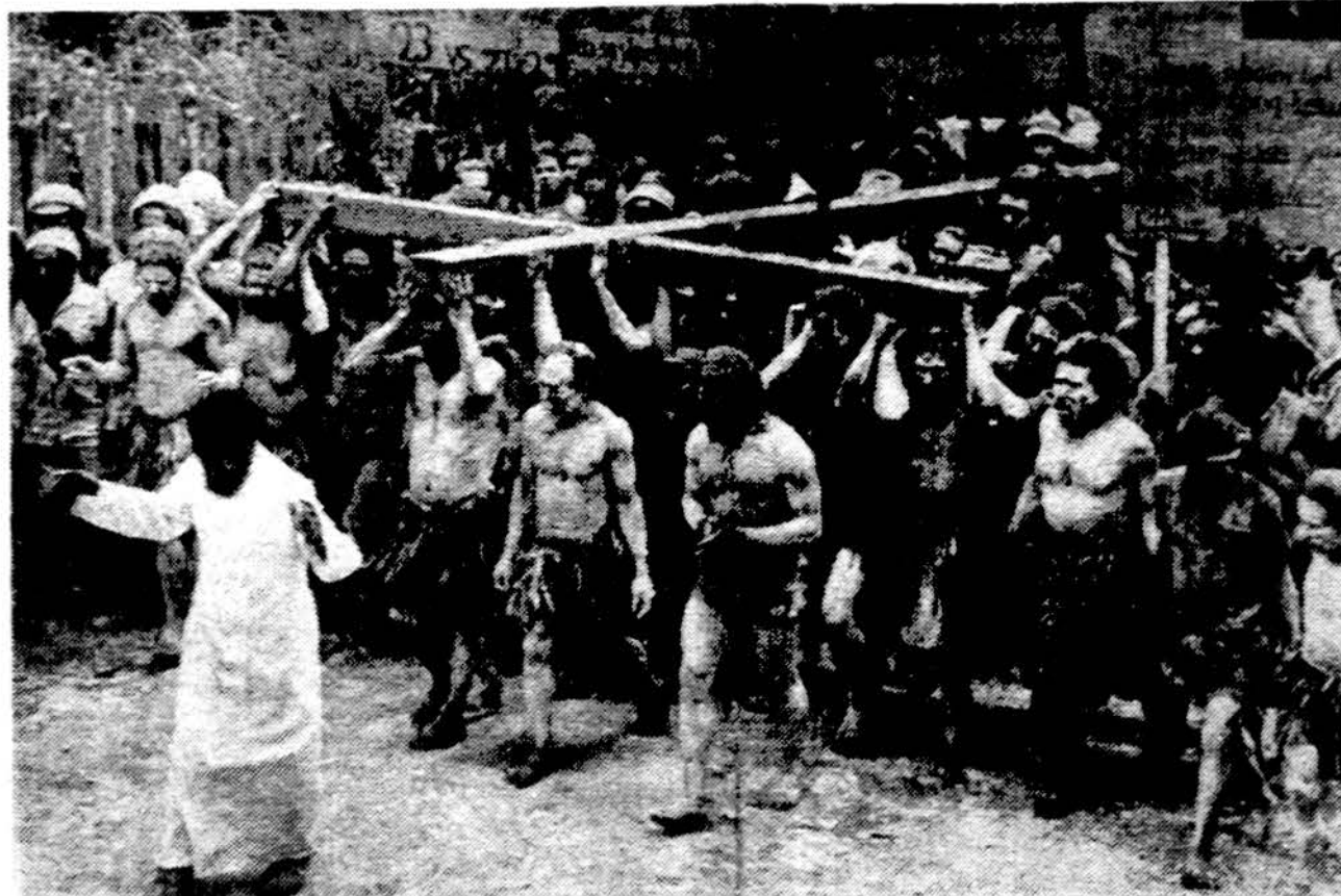
Popiežius Jonas Paulius II šiandien atvyksta į katalikais pėsti keliavo 250 mylių pamatyti popiežių. Papua — Naująją Gineją. Nuotraukoje matomi

— Beirute toliau vyksta kovos tarp musulmonų ir krikščionių. Žuvo 22 žmonės. Susišaudymas išardė planuotą civilių taikos demonstraciją prieš „pamišėlių karą“.