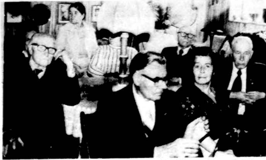
Dalis svečių Sodybos pažmonyje klausosi sveikatos patarimų.