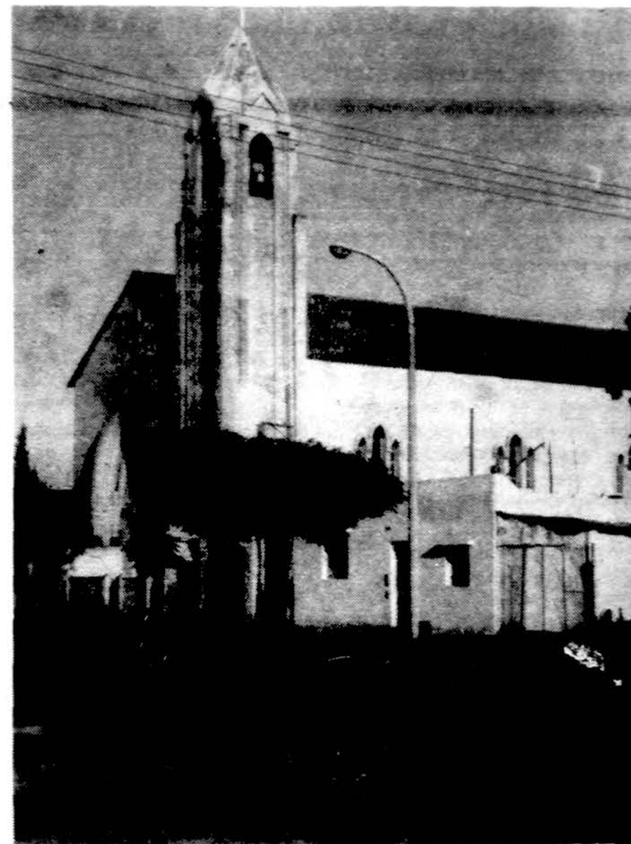
Šv. Kazimiero bažnyčia, vienintelė tokiu titulu bažnyčia Argentinoje.

— Jau kovo mėnesį minėjome šv. Kazimiero 500 metų mirties jubiliejų su šv. Mišiomis, kurias laikė vietos vyskupas ir daug dekanato kunigų. Didesnės iškilmės numatytos šiu metų spalio mėnesį, kai ten prasideda pavasaris. Ruošiamas dvasinis parapijos atsinaujinimas — misijos, var-