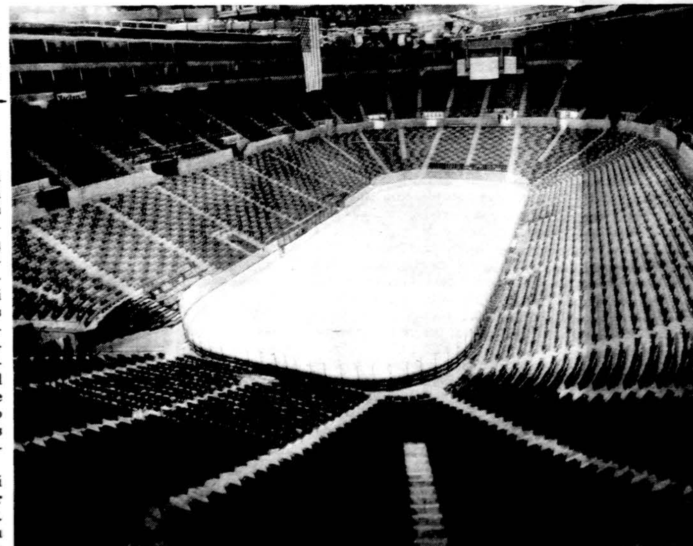
Clevelando Koliziejus, kuriame gali tilpti arti 17,000 žiūrovų, nuotraukoje matyti paruoštas ledo ritulio žaidynėms.

Materialistai ypač domisi įvairiomis iškasenomis, kur tik randama gyvių likučiai. Bet reikia atsargumo su tokiais mokslu ir su tokiais neva mokslininkais.