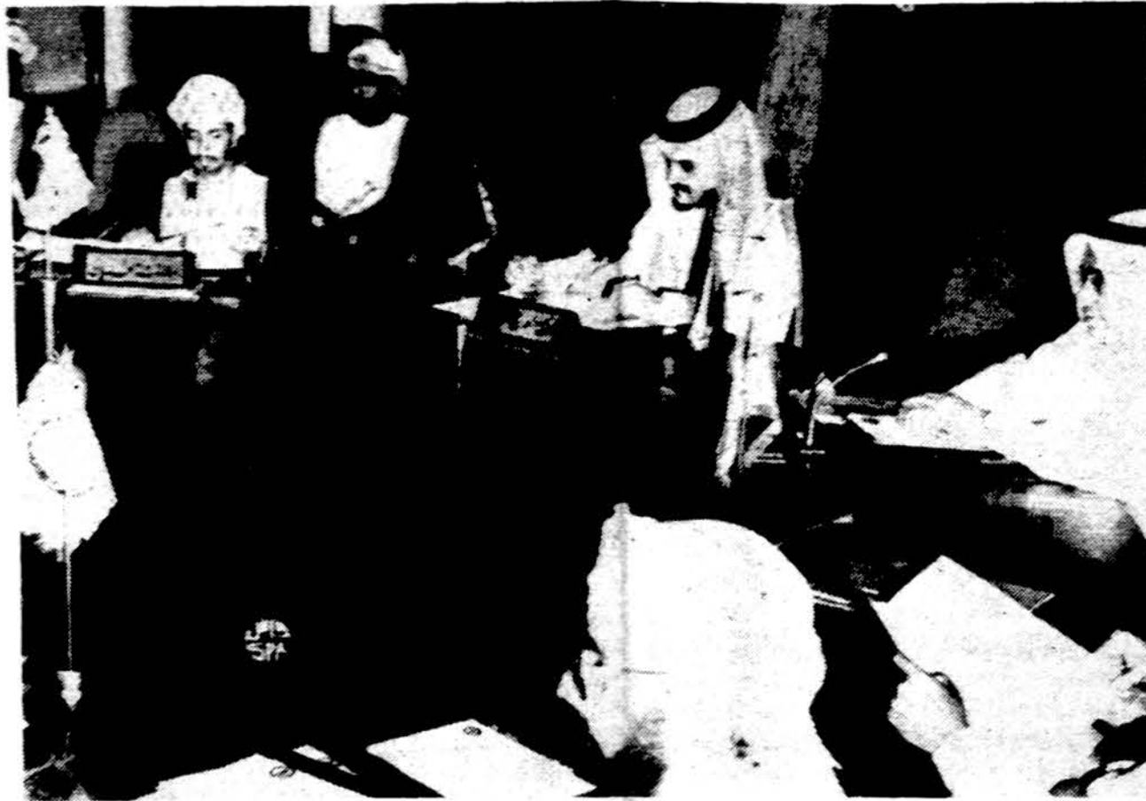
Saudi Arabijoje įvyko naftą eksportuojančių Persų įlankos valstybių ministerių pasitarimas. Iranas buvo pasmerktas už naftos laivų puldinėjimą. Visi Arabų Lygos nariai prašomi padėti sugauti tarptautinės laivininkystės kelius.