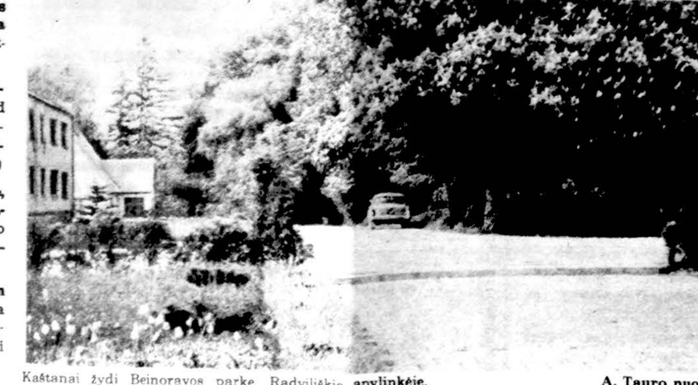
Kaštanai žydi Beinaravos parke, Radviliškio apylinkėje.