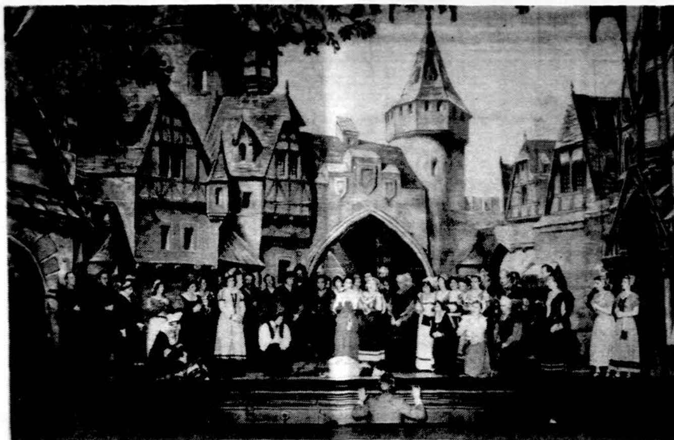
„Fausto“ operos 2 pav. dekoracijos. Operą gegužės 5 ir 6 dienomis statė Chicago lietuviai opera.

Tie mokslininkai aiškina, kad žmonės, per daug prisivalgę mėsos, suseraga apendicitu. Esą, anais laikais, kai žmonės daug vartojo mėsos, jie gyvendavo trumpai — apie 30