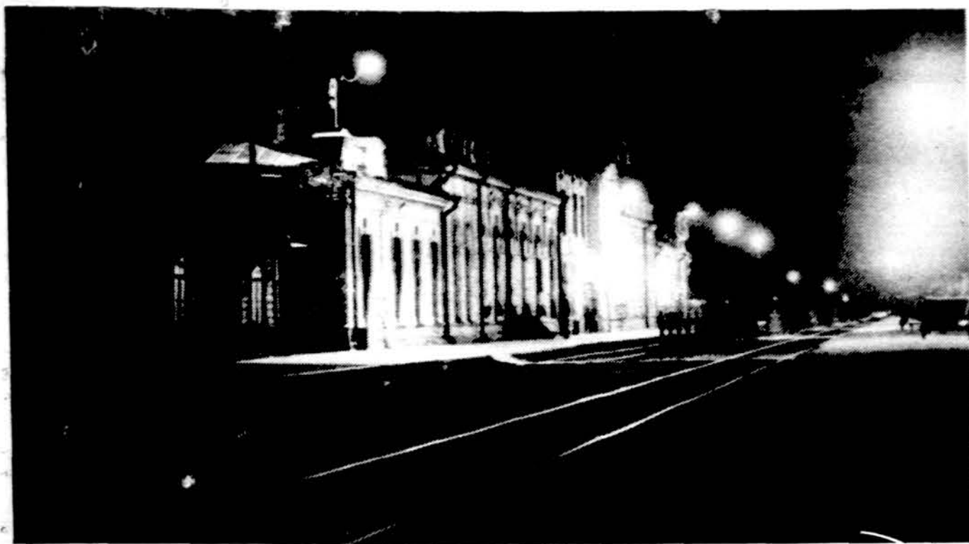
Radviliškio geležinkelio stotis.