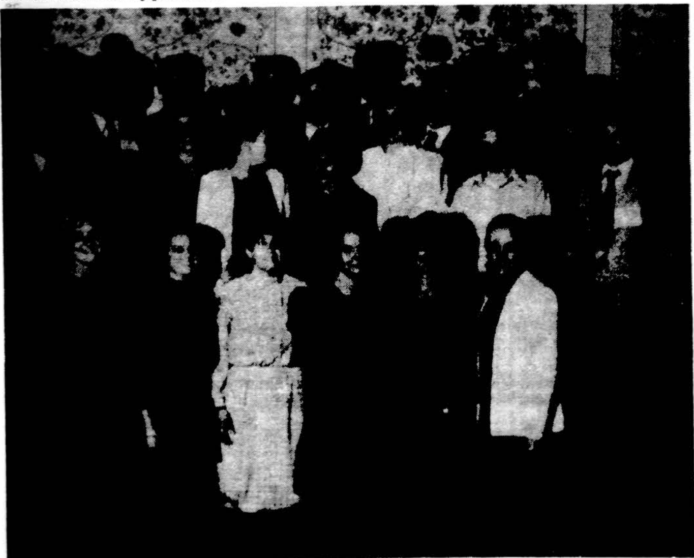
Lietuvių, latvių ir estų jaunimas, susirinkęs pabaltiečių žmogaus teisių konferencijoje Los Angeles.