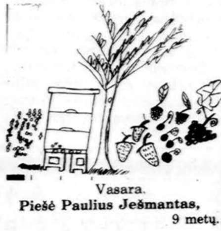
Vasara. Piešė Paulius Ješmantas, 9 metų.

Naujagimio neguldyk prausti trūkusių geldą (vonele), nes užaugęs lovoje susislėpsins. (Seirijai).