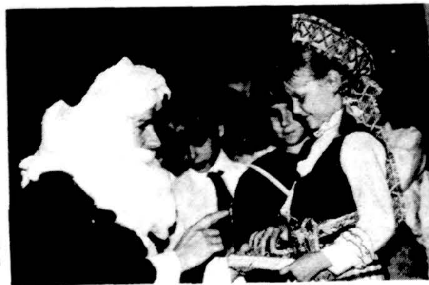
Kalėdų senelis lituanistinėje mokykloje.