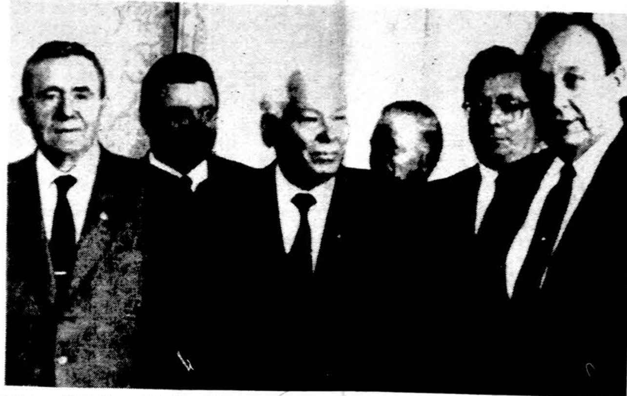
Vakarų Vokietijos užsienio reikalų ministeris Hans Dietrich Genscher (dešinėje) baigė derybas su Kremliu vadais. Viduryje — sovietų prezidentas ir komunistų partijos gen. sekretorius Konstantinas Černenka, kairėje — užsienio reikalų ministeris Andrej Gromyka. Genscheris