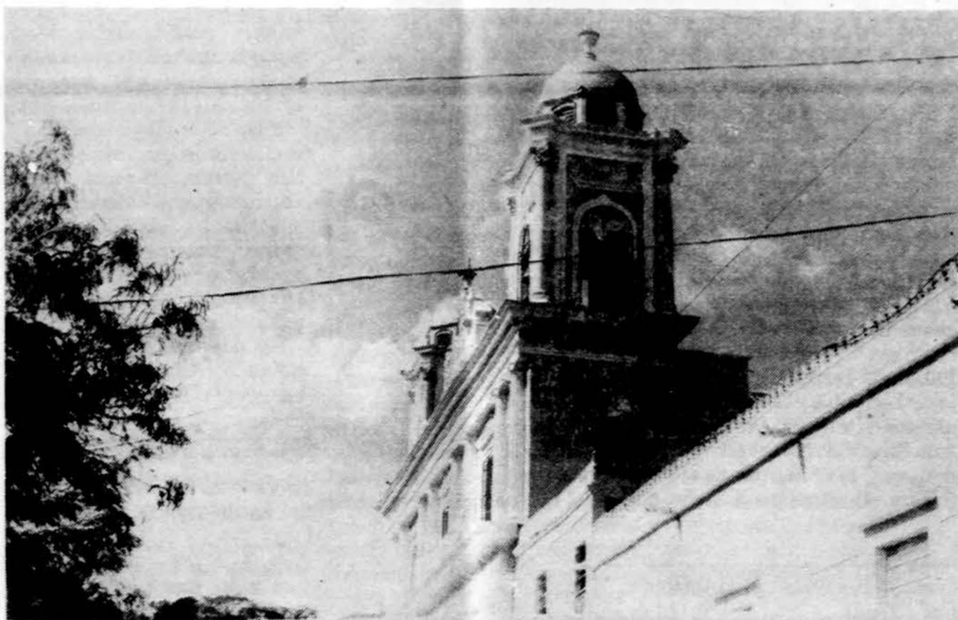
Sv. Kazimiero bažnyčia San Casimiro miestely, Aragavos provincijoje, Venecueloj, bokštai.