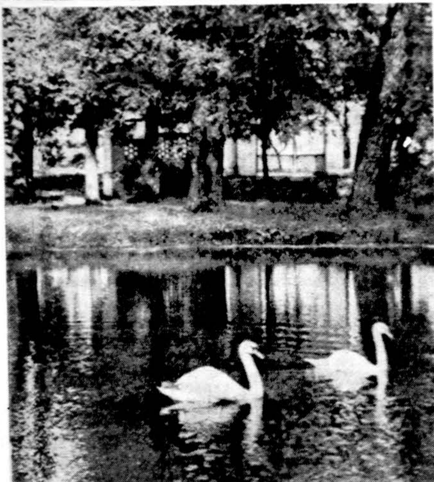
Gulbės Baisogalos parke, Kėdainių apskr.