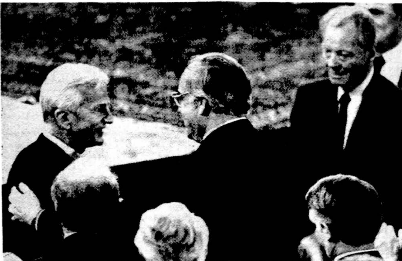
Vakarų Vokietijos parlamentas išrinko naują valstybės prezidentą. Kairėje prezidentas Richard von Weizsäcker, sveikinamas kanclerio Helmut Kohl. Dešinėje — buvęs kancleris, socialdemokratų pirmininkas Willy Brandt.

Prezidentas Weisackeris studijavo Oxforde, Grenoblyje ir Goetingene. Į vokiečių parlamentą jis buvo išrinktas 1969 m.