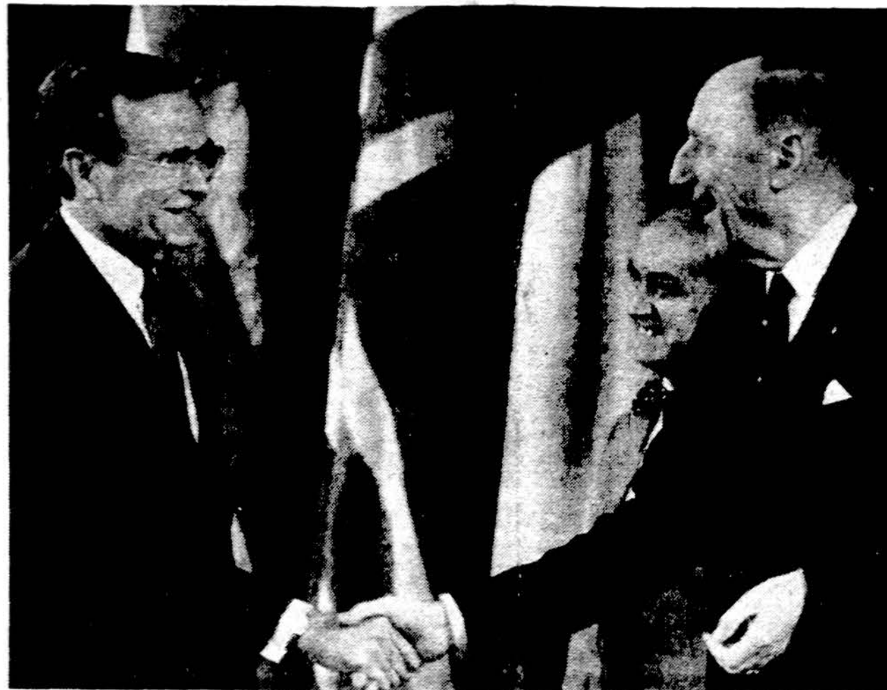
Viceprezidentas Bush NATO valstybių užsienio reikalų konferencijoje Washingtono sveikina su NATO gen. sekretoriumi Joseph Luns. Šis pasitaukia iš pareigų, jo vietą greit perims anglas lordas Carrington. Už Luns matosi Prancūzijos užsienio reikalų min. Cheysson.

— Pietiniame Libane partizanai puolė Izraelio kariuomenės patrulį, žuvo trys izraeliečiai, keturi kariai sužeisti.