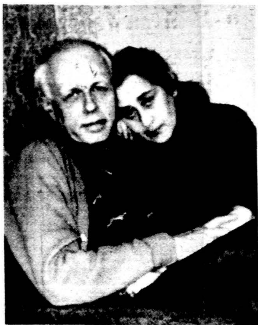
Nobelio Taikos premijos laureatas Andrejus Sacharovas su savo žmona Yelena Bonner. Vakarų agentūrų žinios, jiedu badauja reikalaudami žmonai vizos išvykti į Vakarų. Sovietų „Tass“ skelbia, kad Sacharovas gyvas ir sveikas.

Bahraine pernai laivų judėjimas siekė 800 laivų. Šiuo metu jų plaukioja apie 100. Apie 60 laivų stovi Abu Dhabi uoste, laukdami laivų savininkų instrukcijų. Kuwaito naftos uostai yra vos 10 minučių skridimo atstume nuo Irano Bushire aviacijos bazės. Irano premjeras Mousavi įspėjo Persų įlankos valstybes, kad jos labai silpnos ir užėmė pozicijas, kurias labai sunku apginti. Mes ilgai toleravome jų elgesį ir paramą Irakui, tačiau padėtis pasikeitė. Irano prezidentas Khamenei irgi pasakė, kad įlankos valstybių Iranas neprašo paramos, tačiau prašo laikytis neutraliai. Jei jos išeis prieš mus, visai natūralu, kad teks keisti padarinius. Tai neišvengiamai, pasakė Irano prezidentas.