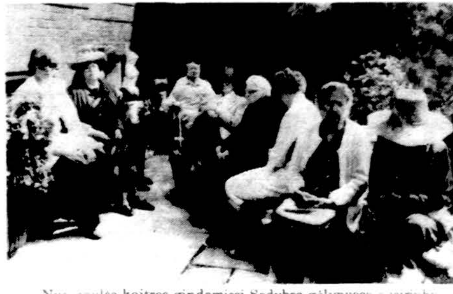
Nuo saulės kaitros gindamiesi Sodybos gėlynuose susirinkusių klauso sveikatos patarimų.