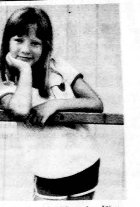
„Neringos“ stovyklautoja džiaugiasi, kad ji gali 3 savaites stovyklauti (nuo liepos 8-28 d.), o jos broliukas tikiai 2 savaites (liepos 29 - rugpjūčio 11 d.). Kaip kiekvienais metais šios dvi stovyklos jau beveik užpildytos. „Neringa“ džiaugiasi savo 15-tais metais auklėjančio darbo su jaunimui zaismingų, stovyklinėse nuotaike. Lietuviai birželio 24 - liepos 7 d. rūpinasi N. Pr. Marijos seserys.

— Ar tame pavasario baliuj? — Buvom, bet išėjom pašokti kitur... Olivija atneša kiaušinieneį ir kiekvienam į lėkštę įveda. — Žinai, Algimantai, kad jaunimas mėgsta savo šokius, o lietuvių parengimose jiems nuobodu... Valgant nėra kada kalbėtis ar įsileisti į kokius ginčus, nes visi skuba. Algimantas pirmasis pabučiavo Oliviją ir išbėga į darbą, tik iš tolo žodžiu atsisveikinęs su vaikais. Olivija taip pat greit pabaigia pusryčius. — Irmute... Suplauk indus, jei dar spėsi... Aš šiandien baisiai vėluojuos! Išėjus tėvui, Irma kiek drąsesnė ir jau dėsto mintis kaip pradėti kalbą su mama, bet dar Arūnas čia maišosi, todėl nedrįsta prie jo pradėti klausiti apie vakar nugirstą tėvų pokalbį. — Gerai, mama... Keistai nuskamba pavadinimas mama šios dabar jai svietimos moters... Tačiau Olivija to ar nepastebi, ar apsimeta nekreipianti dėmesio. Ji taip pat kažkaip keistai žvelgia į Irma, tarsi ji būtų šiandien visai kitokia... Tiesos pažinimas Irmai suteikia tik liūdesį ir susimąstymą. Taip, tai ne jos motina... Bet tokia artima, sava. — Mama! Kur mano algebros vadovėlis? — Penkiolikos metų Arūnas jau prie durų patikrina knygų punda. — Pažiūrėk po lovą! Ten visada kas nors pakliūva! Olivija bėga į miegamąjį pataisyti lūpų spalvą ir apžvelgti save veidrodyje. Vos užsitrenkus durims paskui Arūną, jos vėl Olivijos atidaromos. Prisiminusi atsigrįžta į virtuvės tarpduryje išlydinčią dukterį. (Bus daugiau)