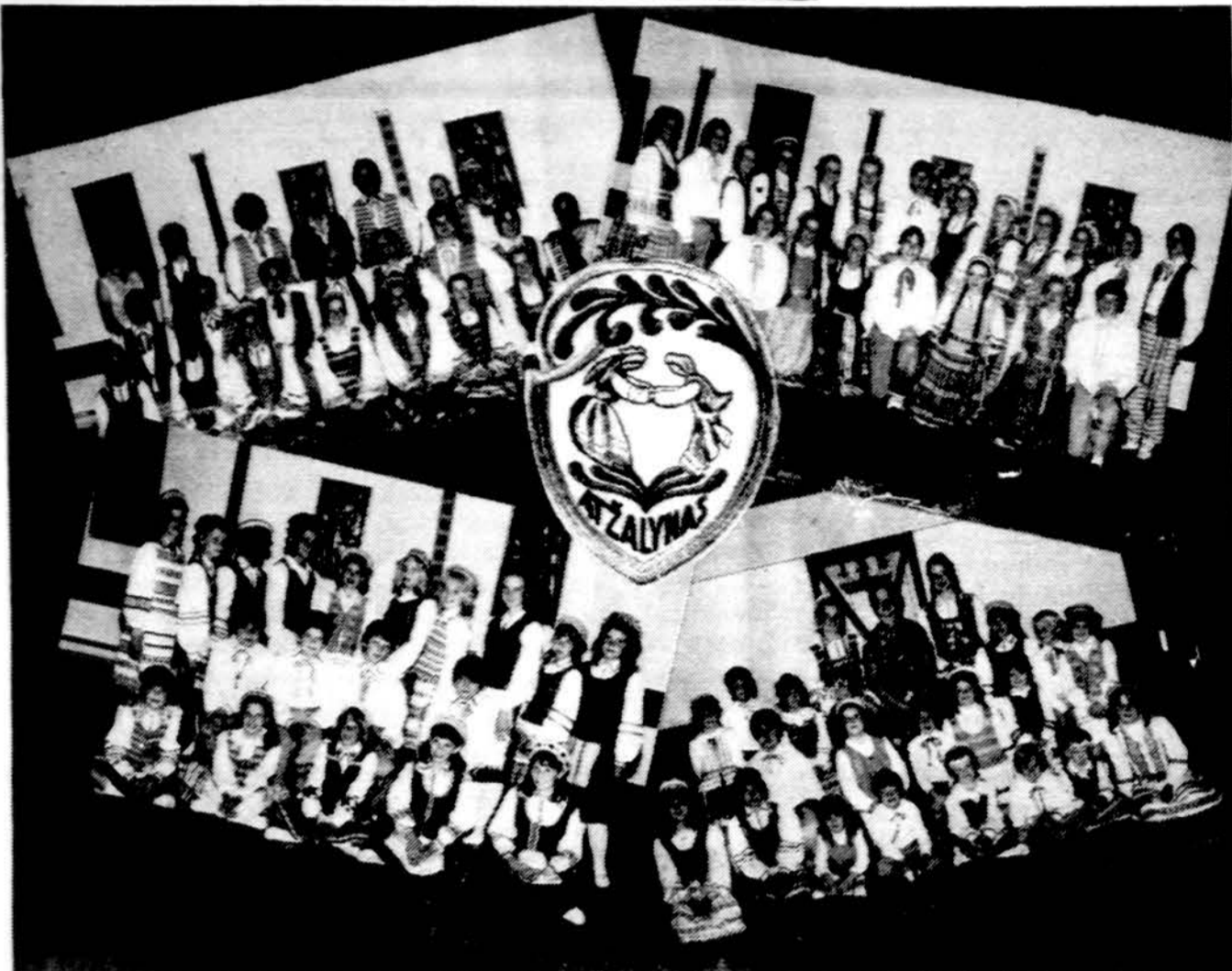
Toronto „Atžalynas“ — 1983 metų Toronto Kara vėno programos dalyviai.