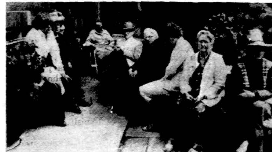
Sodybos gelynuose sodybiečiai ir jų svečiai klausosi medi-ciniskų patarimų.

gausiai ir per dažnai apsilei-džia sveikatos apsaugos rei-kaluose, todėl reikiamo ir galimo gėrio sveikatos srityje nesulaukia.