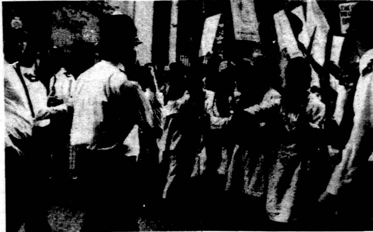
Londonė įvyko apie 20,000 Indijos sikhų tikėjimo žmonių demonstracija. Policija neprileido žygiuotojų prie Indijos ambasados. Sikhai protestuoja dėl jų Auksinės šventyklos Amritsaro mieste išniekinimo.