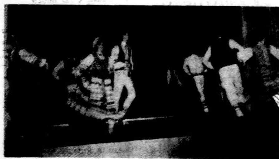
Detroito „Audinys“ šoka.