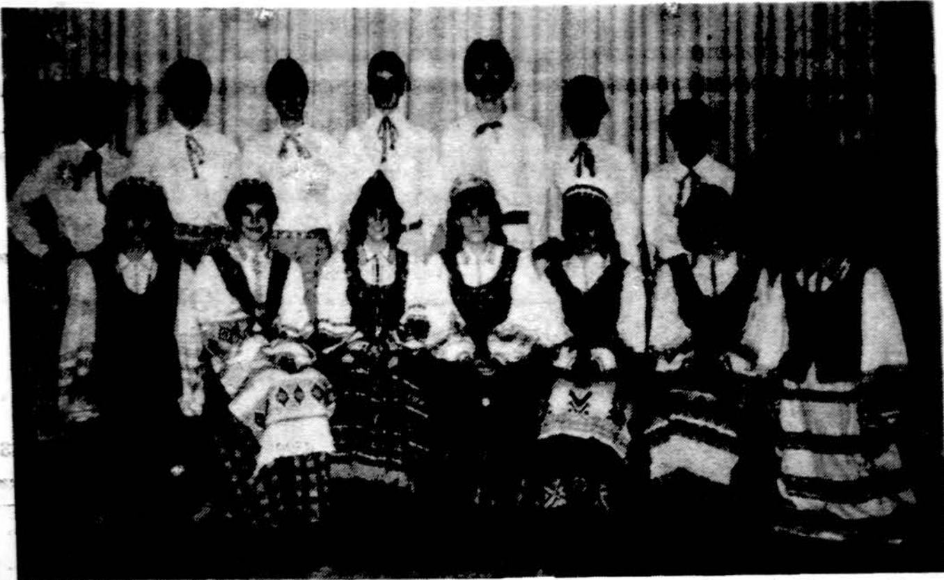
„Audinio“ jaunieji, kurie šoks Richfieldo kolizijoje je prie Clevelando.