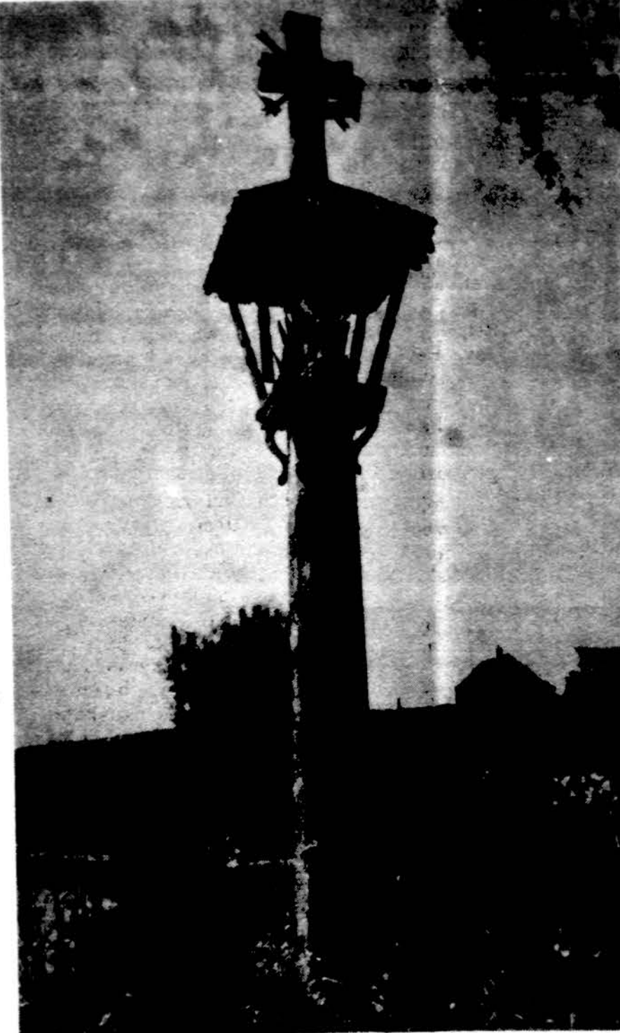
Koplytėlė su Rūpintojėliu. Utenos apylinkė.

LSS Brolijos ir Seserijos Tautinio auklėjimo skyriai gegužės 26-28 d. Dainavoje