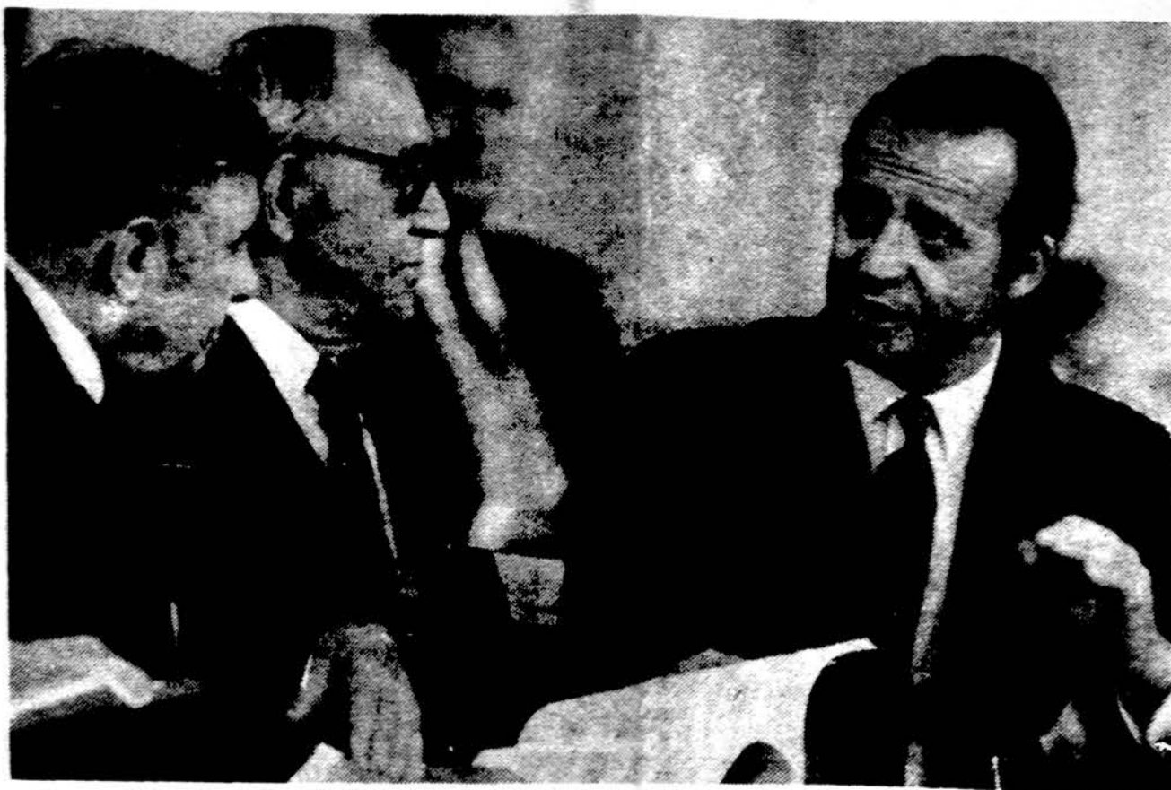
Mokslu metų užbaigimo ceremonijose Harvardo universitetas įteikė garbės doktoratus dešimčiai asmenų. Jų tarpe nuotraukoje matomi: Jeruzalės miesto meras Theodore Kollek, gavęs teisių