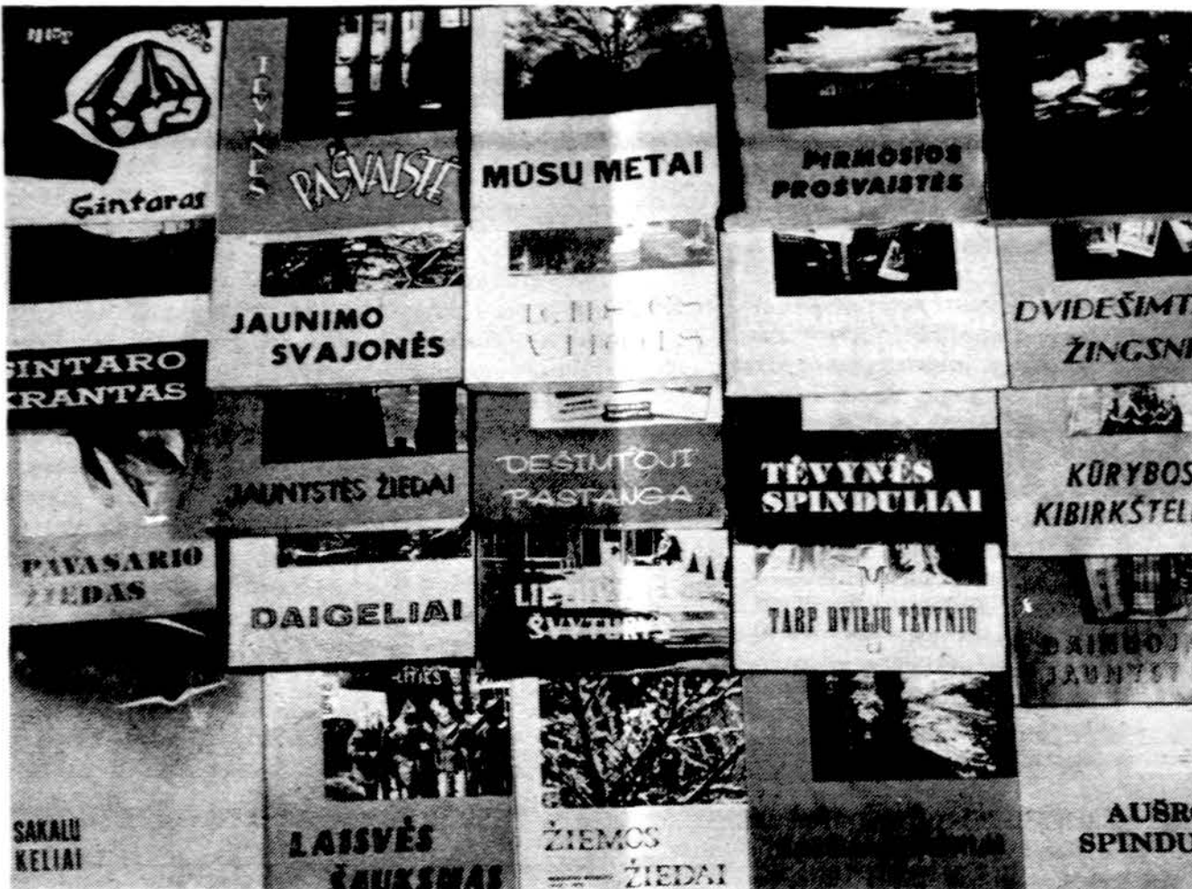
Chicago aukštesniosios lituanistikos mokyklos metraščiai

Pradedant ketvirtuoju ir baigiant 16, metraštyje dalyvavo ir kitos lituanistinės mokyklos: Baltimorės, Cicero, Clevelando Šv. Kazimiero ir Vysk. Valančiaus, Detroito, Brooklyno, Lemonto, Los An-