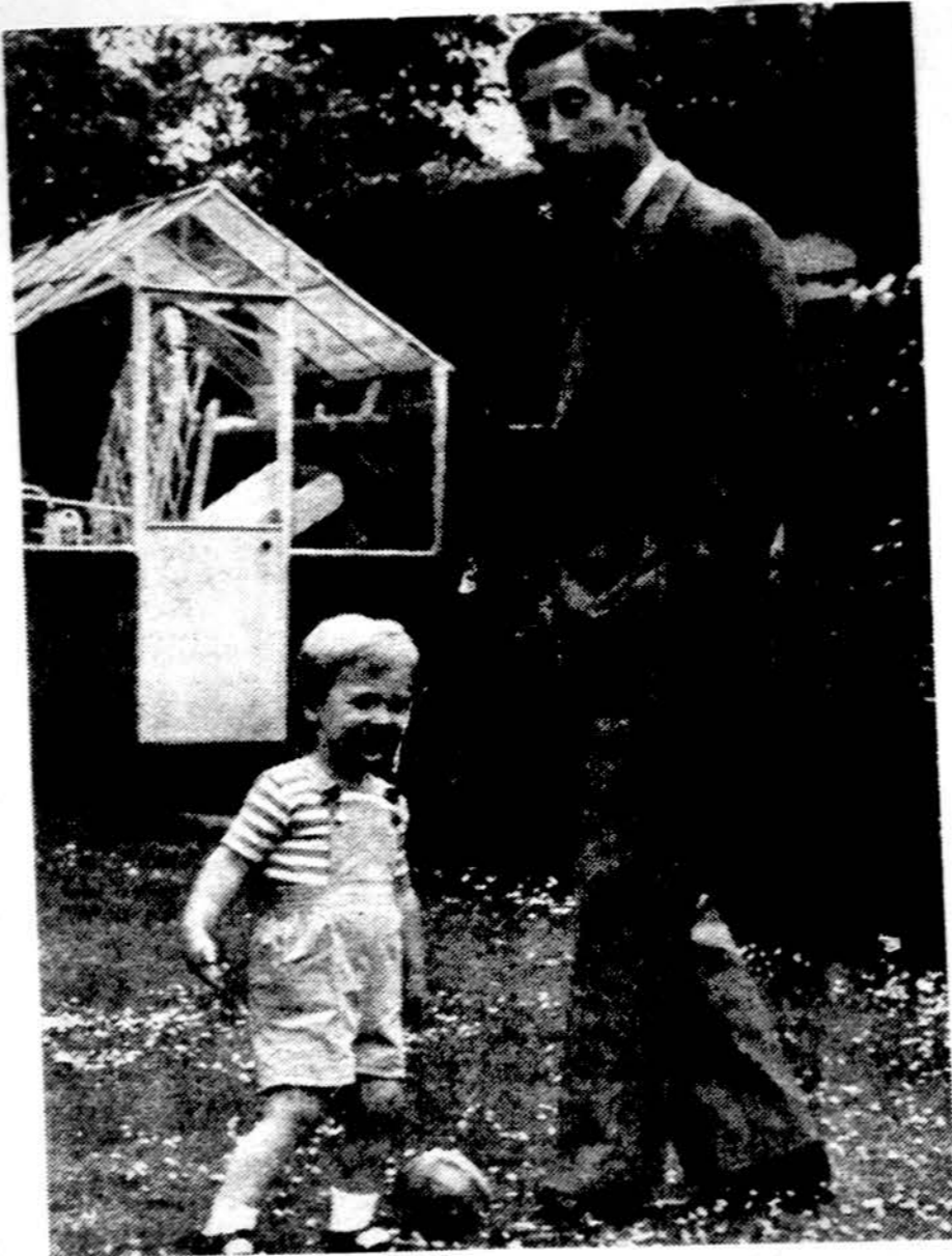
Britanijos sosto ipėdinis princas Carlis sukvietė reporterius į Kensingtono rūmus ir parodė savo pašėjęsį sūnų, princą Williamą, kuriam birželio 21 sueina dveji metai.