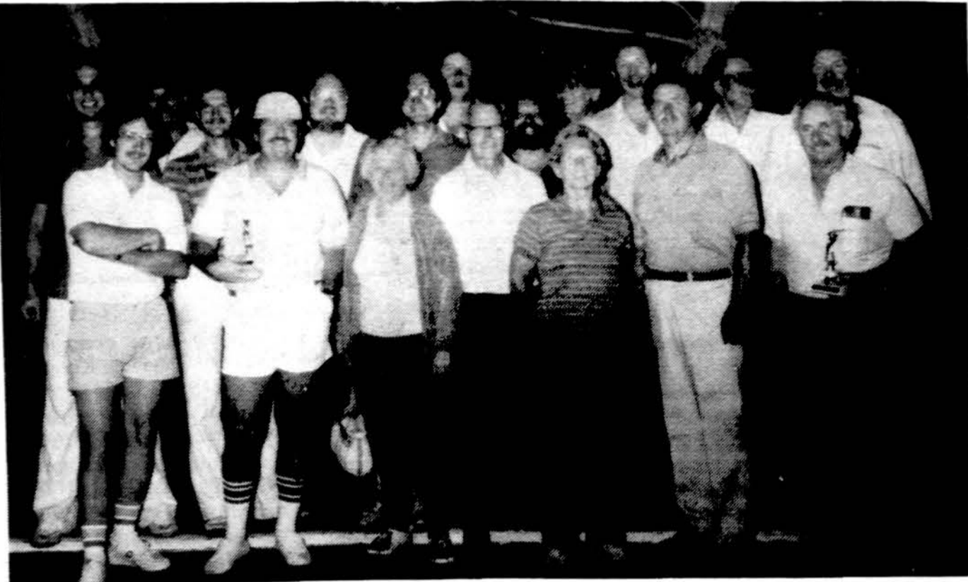
Californijos lietuvių golfo klubo turnyro dalyviai.