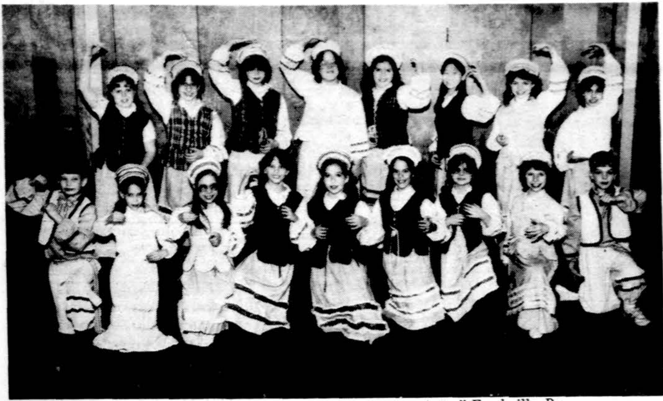
Jaunųjų Lietuvos Vyčių tautinių šokių grupė „Aušra“ Frackville, Pa.