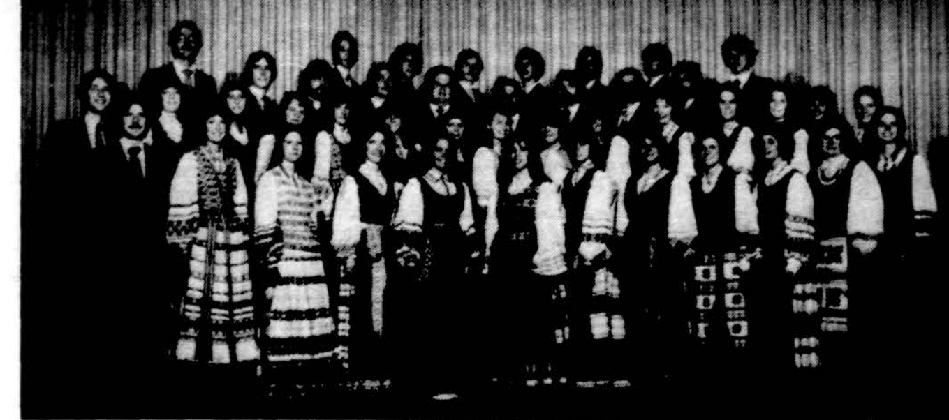
Detroito lietuvių Dievo Apvaizdos parapijos choras.