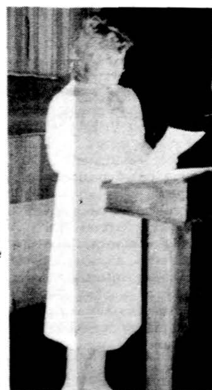
Audronė Brazaitytė skaito paskaitą Motinos dienos minėjime East Chicagoje, Ind.