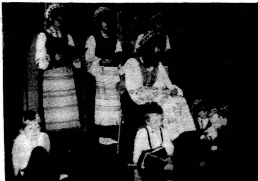
Gary, Ind., lietuvinė mokyklos mokiniai atlieka programą Motinos dienos minėjime East Chicago, Ind.