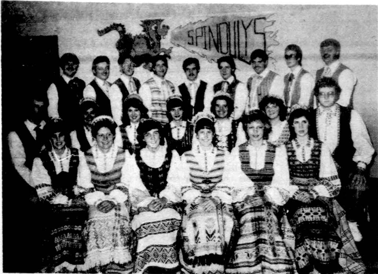
Lemonto „Spindulio“ tautinių šokių grupė pasi ruošusi dalyvauti septintoje Tautinių šokių šventėje Clevelande.