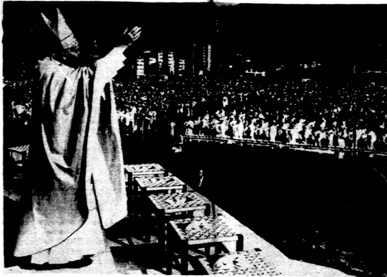
Popiežius Jonas Paulius II, baigdamas savo vizitą Sveicarijoje, palaimino Siono aerodrome susirinkusią sveicarų minią.

— Olandijos valdžia nutarė neparduoti savo Šiaurės jūros naftos Pietų Afrikos respublikai.