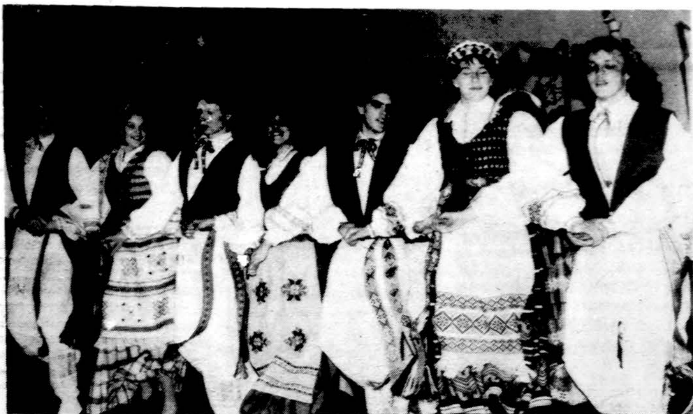
Vasario 16 gimnazijos šokėjų dalis. Jie ruošiasi šokti Liet. Tautinių šokių šventėje Clevelande.