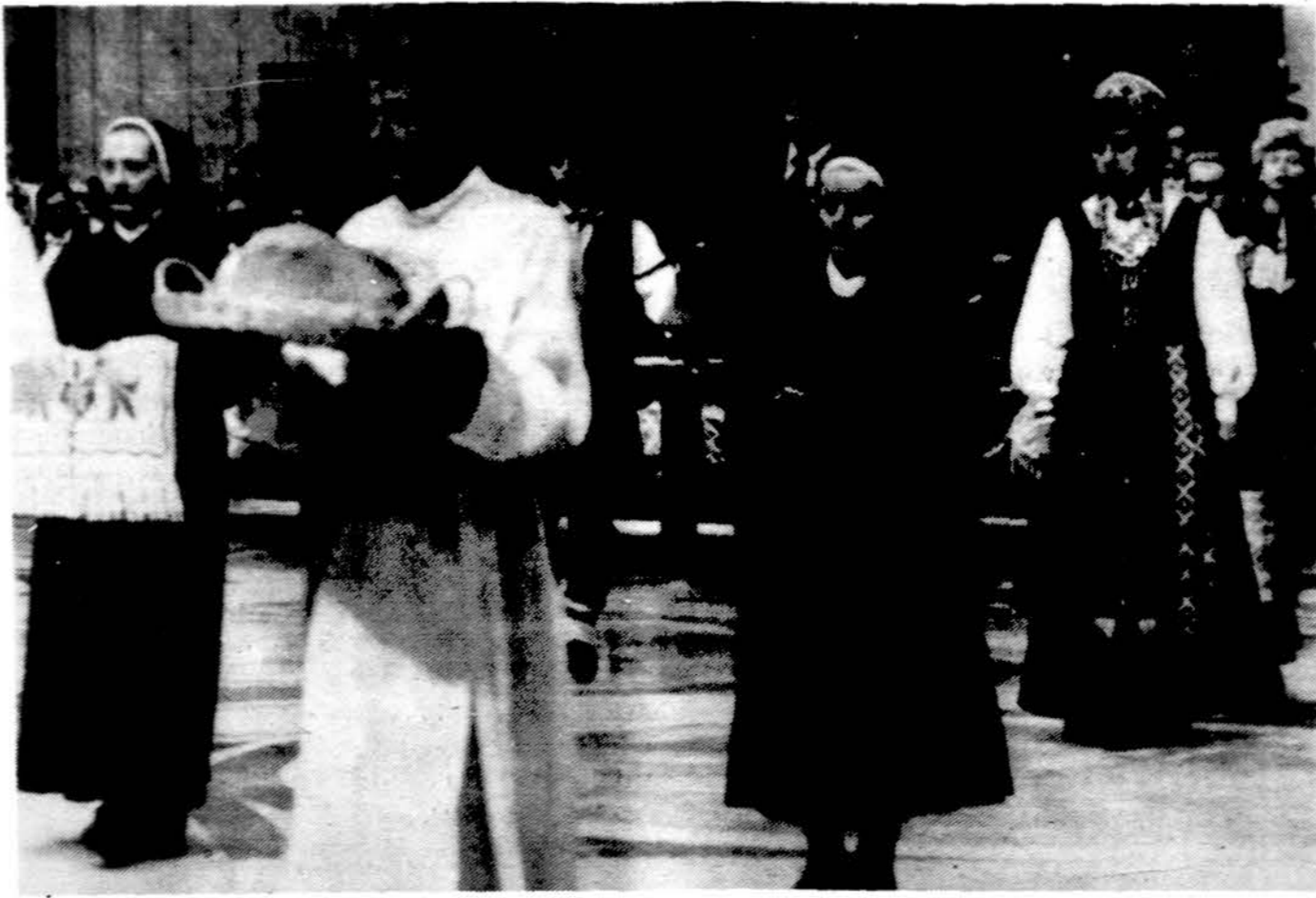
Šv. Kazimiero 500 metų mirties sukaktuvių minėjimo iškilmėse Romoje, per šv. Mišias Sv. Petro bazilikoje nešamos aukojimo dovanos — lietuviškų vienuolių ir organizacijų atstovai neša savo dovanėles.