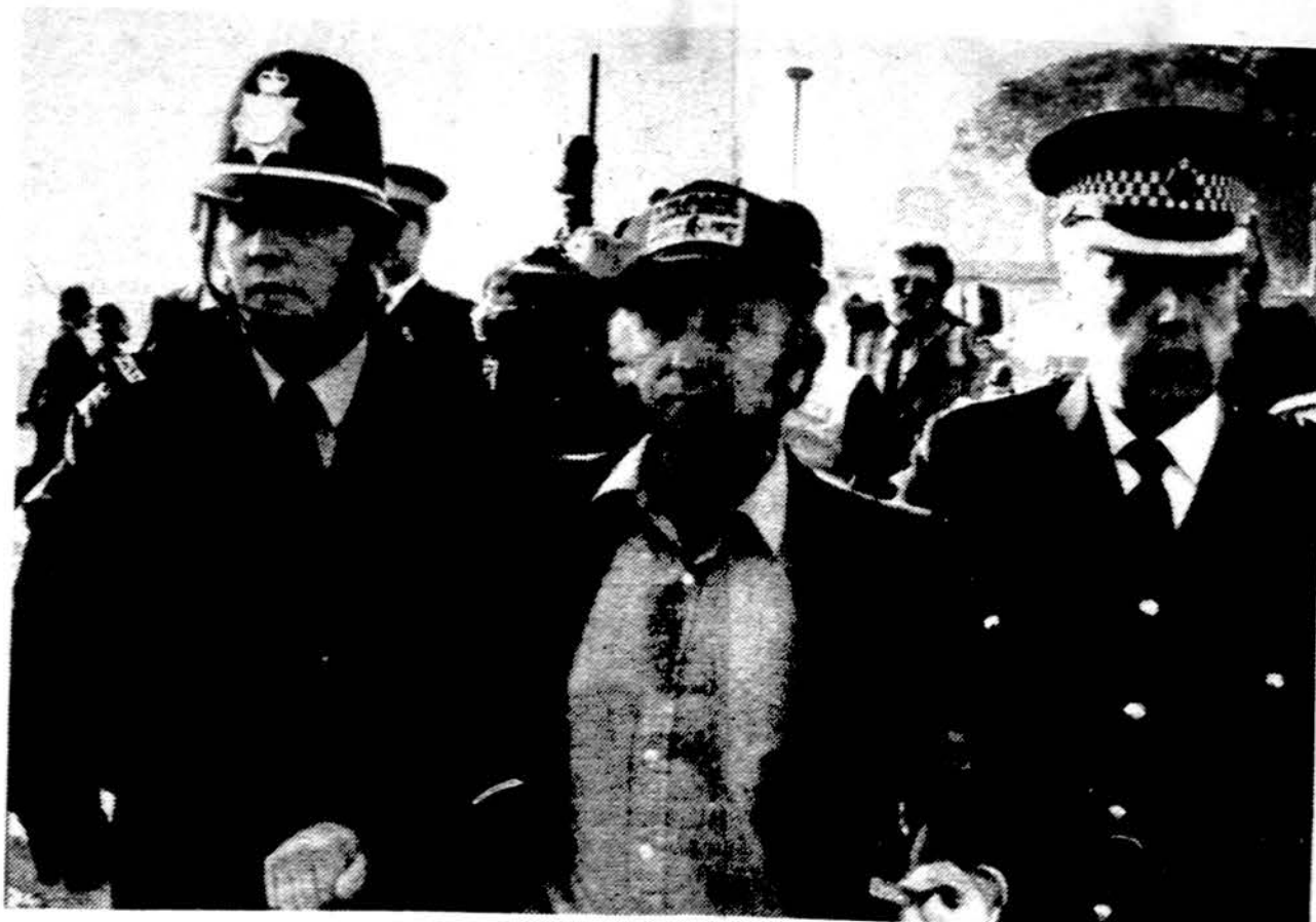
Britanijos policija turi daug sunkumų su angliakasių streiku. Nuotraukoje — suimtas angliakasių profesinės sąjungos vadovas Arthur Scargill, kuris aktyviai dalyvauja smurto žygiuose prieš streiklauišius. O'Grave kasyklose jis buvo

Oficialiai Vakarų Vokietija laikosi pažūtos, kad teritorinis Vokietijos klausimas yra atviras. Legaliai padėtis yra ta pati, kuri buvo 1937 m. Jokios taikos konferencijos iki šiol po Antrojo pasaulinio karo nebuvo. Vakarų Vokietijos diplomatas Varšuvoje pasakė, kad Bonoje absoliučiai nėra jokių sumanymų keisti dabartines sienas. Lenkijos spauda tačiau įsitikinusi, kad vokiečiai revanšistai pagyvino veiklą, kai į valdžią atėjo kancleris Kohl krikščionys demokratai.