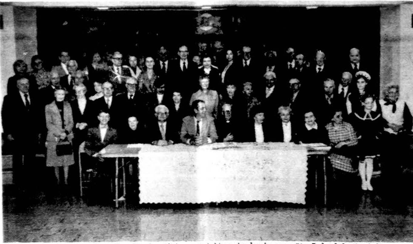
Lietuvių Istorijos draugijos 31 visuotinio susirinkimo, įvykusio gegužės 5 d., dalyvių dalis.

x Ieškoma sekretorė — lietuviškai įstaigai New York. Pageidautina, kad laisvai valdytų lietuvių ir anglų kalbą, mokėtų gerai rašyti rašoma mašinėle, efektyviai komuniuoti telefonu ir raštu bei vairuoti. Darbo pareigos pagrindinai apima mašinraščio darbus, siuntų pakavimą bei prašymų pildymą ir išsiuntimą ir kitus techniskus-administracinius rūpesčius. Darbo sąlygos bus aptartos su rimtais kandidatais. Siųsti reziume: Lithuanian Catholic Religious Aid, 351 Highland Blvd., Brooklyn, NY 11207. (sk.)