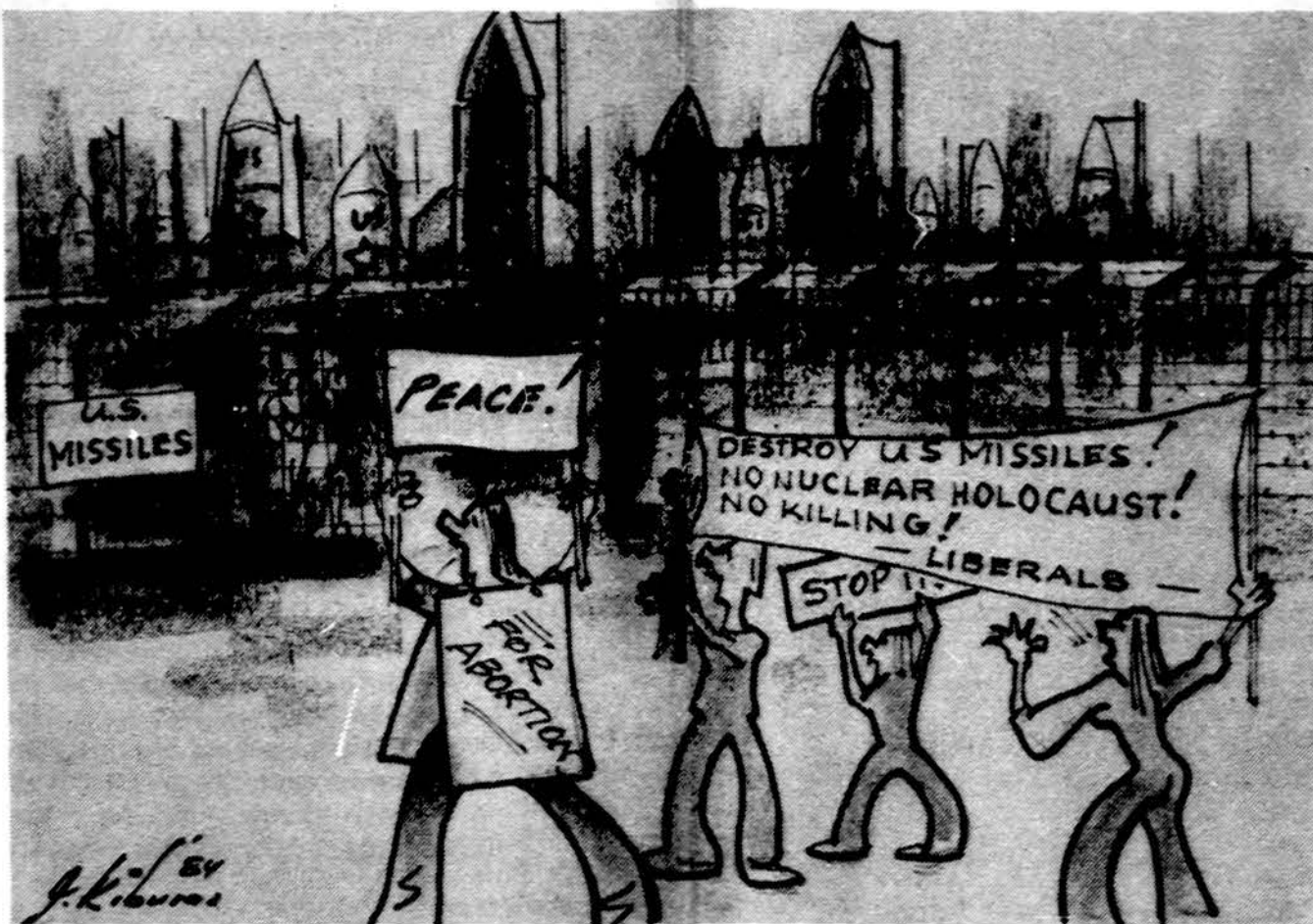
Taikos aktyvistai surengė piktas demonstracijas Wilmingtone, Mass., netoli Bostono. Karikatūrininkui atrodo, kad jie smerkia žudymus, tačiau