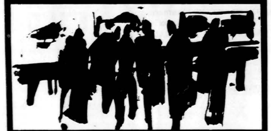
BLAHA • CHIARA • DARGIS • DEGUTIS • IGNAS • KEZYS LINGERTAITIS • PALUBINSKIENE • PETRIKONIS • RIMAS • SILGALIENE SHUKYS • VASKYS • VENCLAUSKAS • ZOTOVIENE • ZUMBAKIENE

Užsakymus siųsti: "DRAUGAS", 4545 W. 63rd Street, Chicago, IL 60629