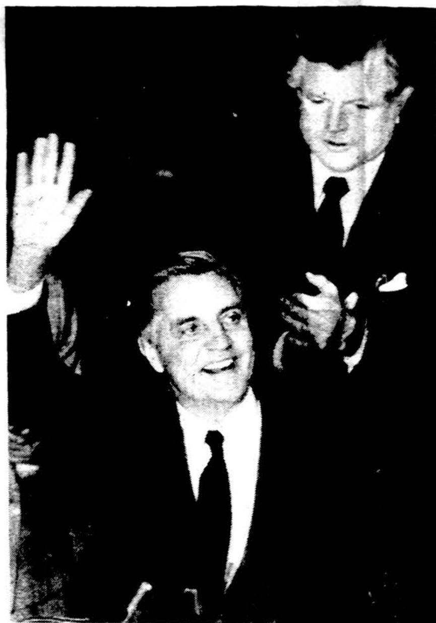
Po piktos demokratų pirminių rinkimų kampanijos, partijos veikėjai siekia vienybės ir susiklausymo. Senatorius Edward Kennedy nuvyko į Minnesotą ir pasikalbė, kad jis remia ir kitus raižina palaikyti buvusio viceprezidento Walter Mondale kandidatūrą į prezidento vietą.