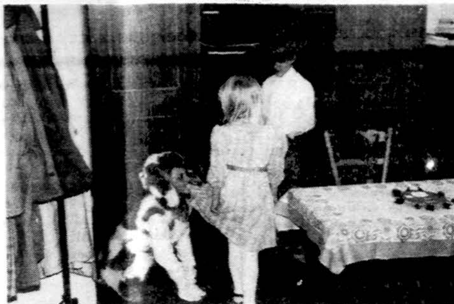
Lietuvių mažieji atlieka Motinos dienos programą Miunchene.